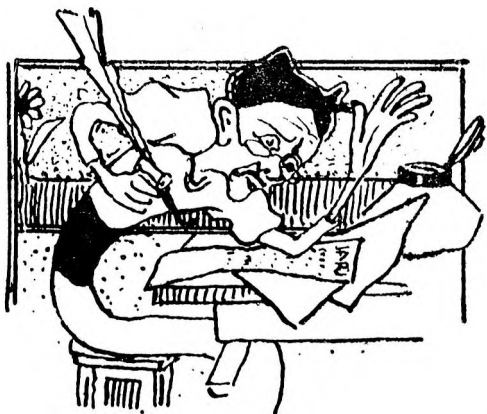
dar fericirea lor nu dură mult, căci nestătornic și infidel cum toți bărbații, el o părăsi în curând,