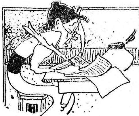
lăsând o pe ea cu inima frântă de durere, oftând amar după visul tinereții ei nimicite!