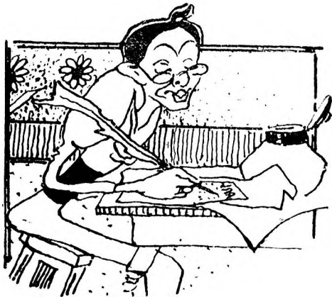
Se iubiău cu focul sint al primului lor amor plin de vrajă,