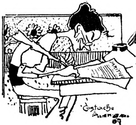
învins de iubirea ei neșermurită — căci ea, chiar în bu-tul infidelității lui nu l uitasă — s'ntorsă iar la ea și-o luă de soție, trăind cu ea mulți ani fericiți.