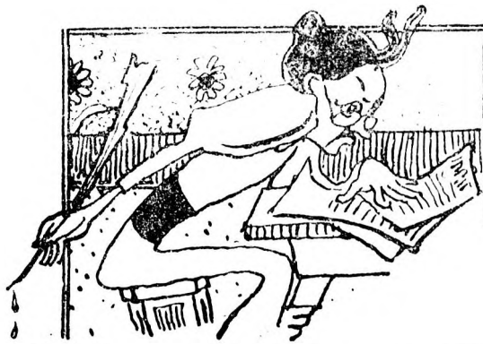
Și el trecu apoi dela amor la amor, nimicind rînd pe rînd alte inime nevinovate, până în sfîrșit