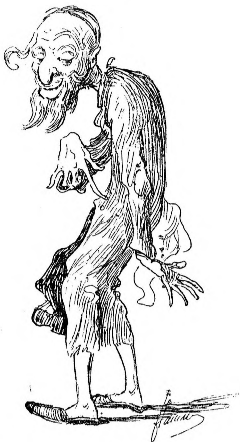
Șloim Glanzwichts în negligé.