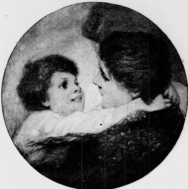
Édes, édes anyám! — Festette Laukota Hermin.

— Magától értetődik. Dolgozószobára neked nem nagy szükséged van már. Ha pedig Mimosza urnak sikerül családfádat egybeállítani, akkor ugyanis nagy házat kell vinnünk.