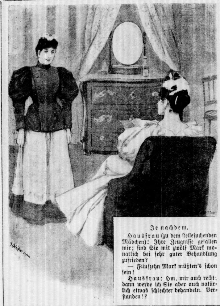
Je nachdem. Hausfrau (zu dem hellestehenden Mädchen): Ihre Jugendzeit gestalten mir; sind Sie mit zwölf Markt monatlich bei sehr guter Behandlung zufrieden? — Fünfzehn Markt müßten's schon sein! Hausfrau: Oh, mir auch recht; dann werde ich Sie aber auch natürlich etwas schlechter behandeln. Verstanden!?

Ein Opferball. — Fast unbegreiflich erscheint es, daß man zur Zeit der großen Revolution in Frankreich sich Bergnügungen und vor allem dem Tanze hingab, ja daß sogar sogenannte „Opferbälle“ (bal des victimes) existierten, an welchen nur diejenigen teilnehmen durften, welche einen Angehörigen durch die Guillotine verloren hatten. Die anwesenden Damen charakterisierten das „Fest“ noch dadurch, indem sie statt jeden anderen Schmuckes ein schmales rotes Bändchen um den Hals trugen und so an die Todesart der Opfer der Schreckensherrschaft erinnerten. Auf einem solchen Balle ereignete es sich, daß zwei Schmeltern sich wiederfanden, von denen jede glaubte, die andere sei guillotiniert worden. Ihre Freude beim Wiedersehen soll natürlich ungeheuer gewesen sein, fast ebenso groß aber — ihr Bedauern, als man ihnen eröffnete, sie hätten den Saal zu verlassen, da ihr Zutritt nun kein berechtigter mehr sei. (E. K.)