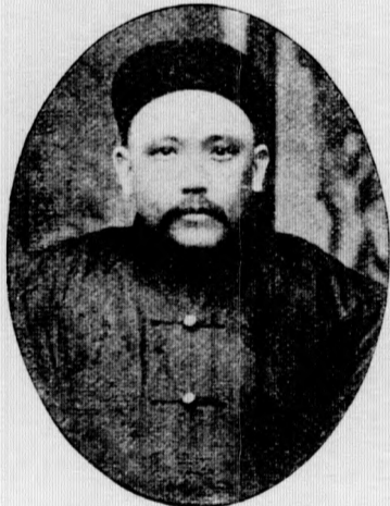
Quantität, Biegsamkeit von Feigl. (S. 64)

„Für eine Schauspielerin wäre das, wie ich denke, keine besondere Leistung.“