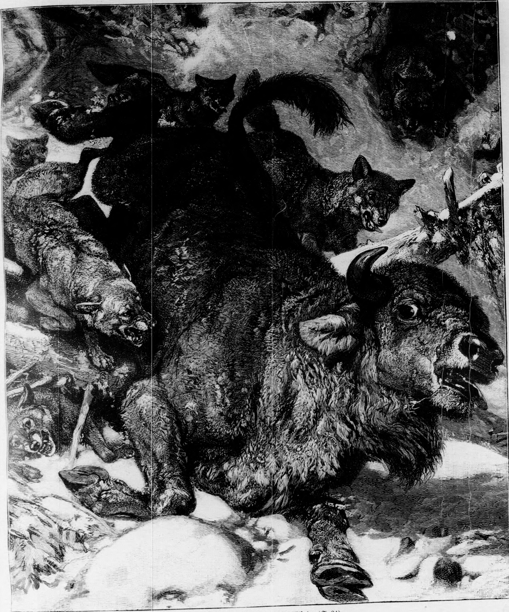
Alter Wisent, von Wölfen überwältigt. (S. 64)

... eine halbe Stunde lang darin aufzuhalten, ohne als Schopperin erkannt zu werden. Einer meiner Leute, der von den gewählten Verkleidungen Kenntnis erhalten muß, wird dort sein, um Sie zu beobachten. Lautet sein Bericht günstig, so schließen wir morgen mittag einen Vertrag, nach welchem Sie sich verpflichten, den Auftrag mit allen Ihnen zu Gebote stehenden Kräften durchzuführen, während ich es namens der Pinkertonschen Agentur übernehme, den Verbleib Ihres verschwundenen Gatten zu ermitteln. Selbstverständlich gewähre ich Ihnen für die Dauer Ihrer Thätigkeit an Geldmitteln und sonstiger Unterstützung alles, dessen Sie bedürfen.