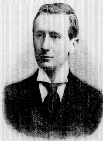
Guglielmo Marconi. (S. 64)

eine halbe Stunde erkannt zu werden. Verleumdungen kennt beobachten. Lautet mittag einen Vertra