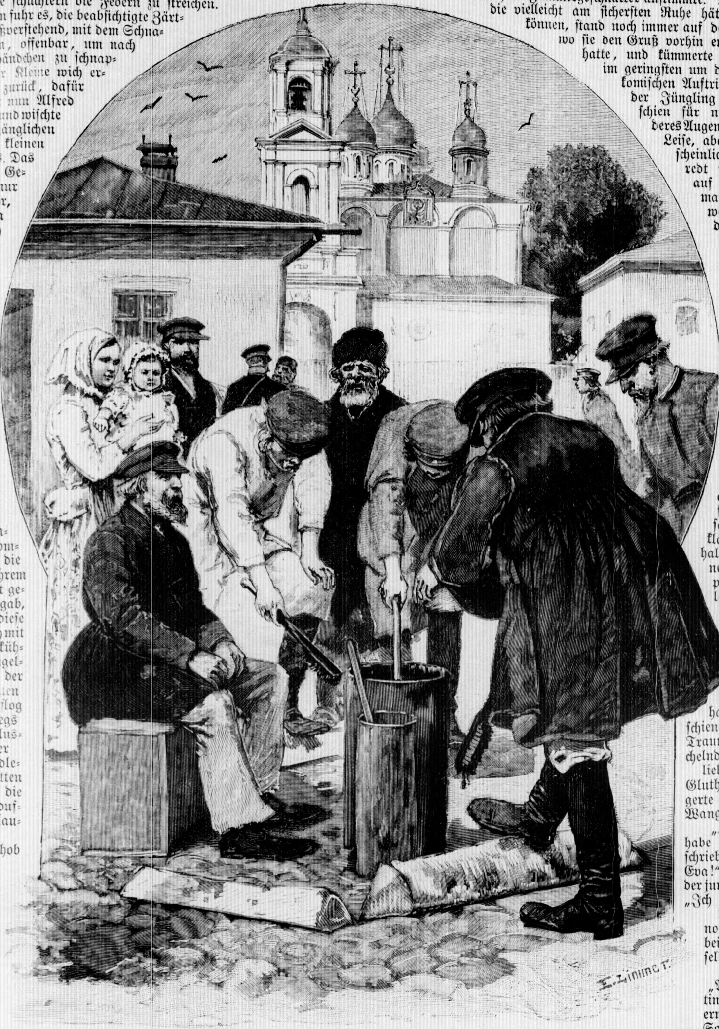
Gelegenheit zum Stiefelschmieren in Moskau. (S. 124)