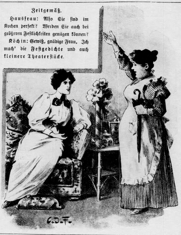
Zeitgemäß. Hausfrau: Wo Sie sind im Kochen perfekt? Werden Sie auch bei größeren Festlichkeiten genügen können? Köchin: Gewiß, gnädige Frau. Ich mach' die Festgebäckte und auch kleinere Theaterküde.