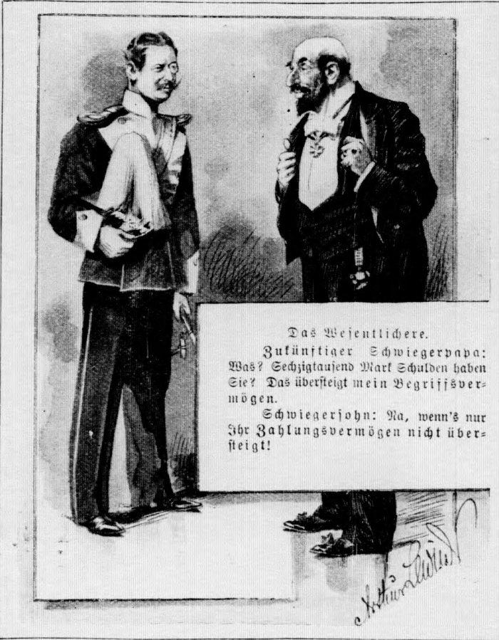
Das Wesentlichere. Zukünftiger Schwiegerpapa: Was? Schlichtastend Mart Schulden haben Sie? Das übersteigt mein Begriffsvermögen. Schwiegerjohn: Na, wenn's nur Ihre Zahlungsvermögen nicht übersteigt!