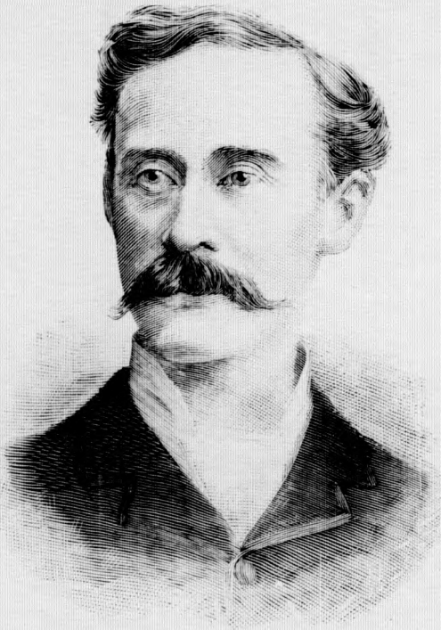
Nordpolarforscher Robert G. Peary. (S. 176)

„Nun lachte das Mädchen laut auf. „Nein, Herr Kormorski, Ihnen steht das Schmeicheln wirklich nicht zu Gesicht; überlassen Sie das unseren anderen Herren! Sie haben das nicht nötig.“ „Wie so?“