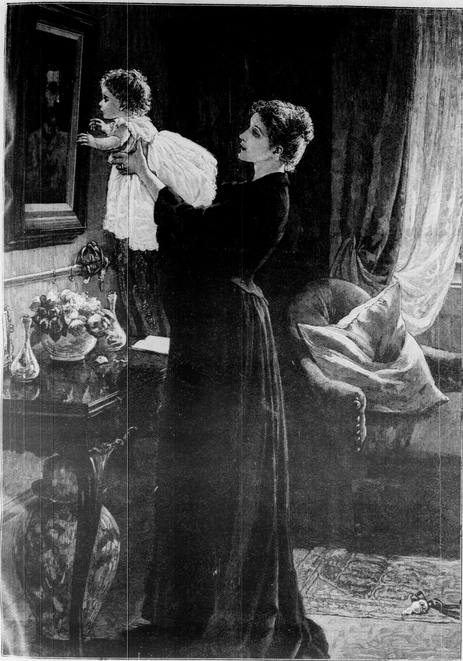
Am Allerheiligentage. (S. 176)

... der Herzen be- ... Was für komische ... Mann sich dar- ... zu stellen zu hören. ... Maria. Sein Herz ... auf die Gedanken ... wieder um ihr ... nicht mehr sie. Und ... was ward. ... von Maria. Sie sah ... die ihre Bewegung wach ... (Bergung folgt.)