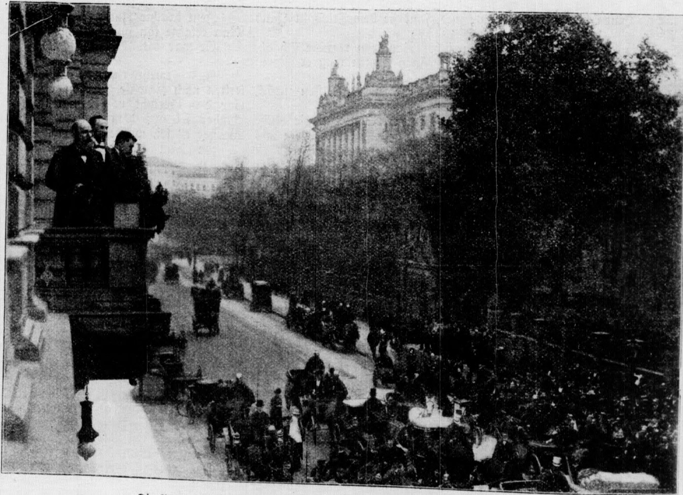
Die Buren generale auf dem Balkon des Hotels „Prinz Albrecht“ in Berlin.

Die alte Bastion bei Niva. (Mit Bild auf Seite 187.) — Die malerische Umgebung des Städtchens Niva am Nordende des Gardasees hat auf der Seite, wo vom Abhang der steilen Rogetta die alte „Bastion“, il bastione, herabragt, einen düsteren Charakter. Die Bastion und der runde Turm sind die Reste eines starken Kastells, das wohl schon in den Zeiten der Völkerwanderung die Straße am rechten Ufer des Gardasees beherrschte. Das berühmte Herrscherhaus der Staliger von Verona, das im 13. Jahrhundert auch Niva an sich brachte, machte das Kastell zu einem uneinnehmbaren Bollwerk. Als solches galt es auch noch, als die Staliger von Venedig besiegt wurden, und Niva in den Besitz der stolzen Republik am Adriatischen Meer kam. Von Kaiser