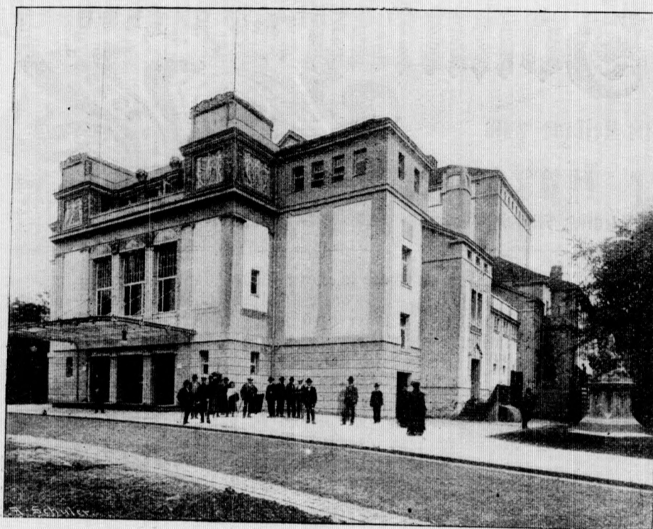
Das Interimtheater in Stuttgart. Nach einer Photographie von A. Gierlinger in Stuttgart.

Ein herrlicher Regenbogen strahlte über das Land, er sah aus, als sei er ein Zeichen, daß Friede sein soll zwischen Himmel und Erde.