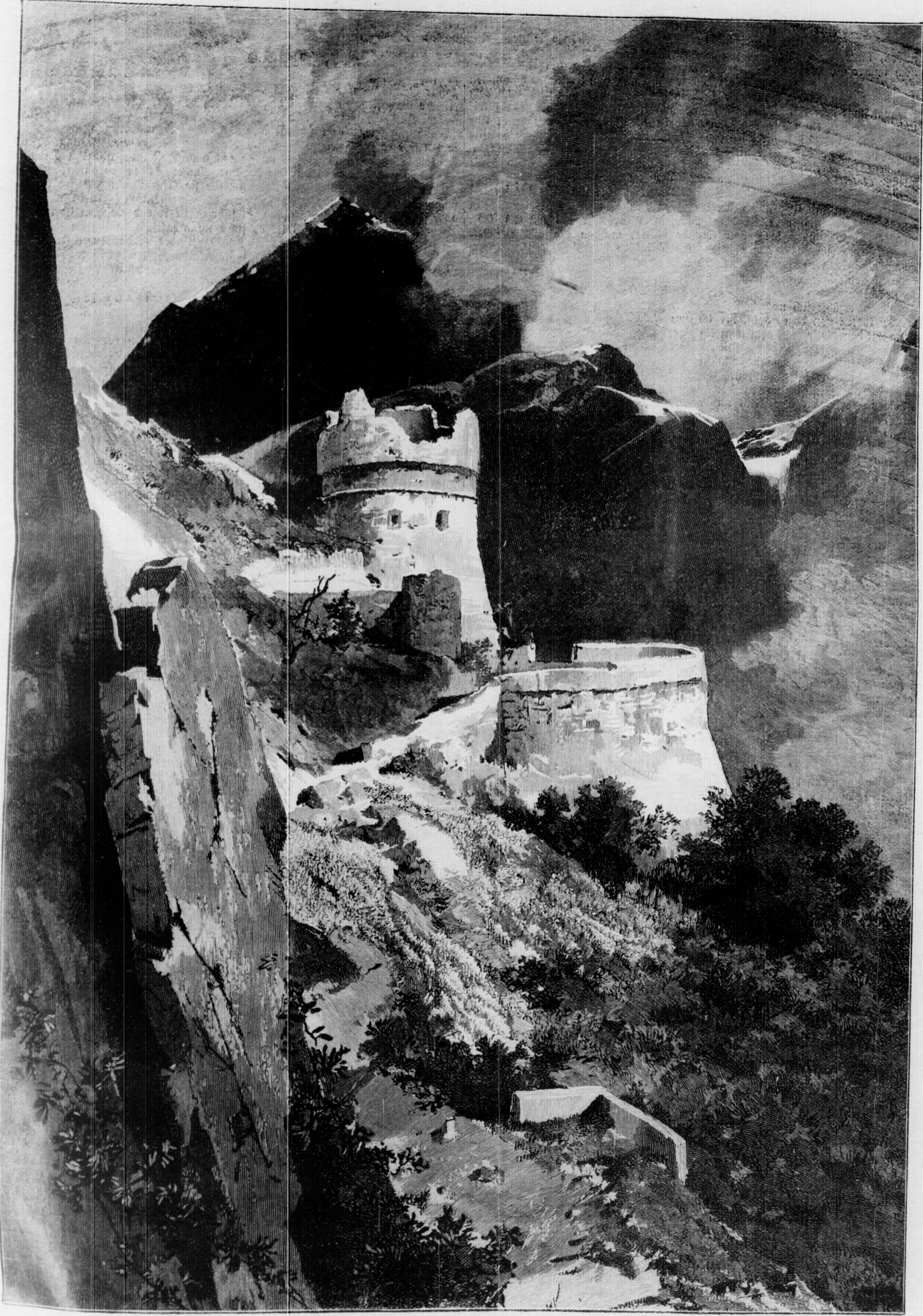
Die alte Bastion bei Riva. (S. 186)

187. — Die materielle zustand hat auf der Seite, il bastione, bewachung, nde Turm sind die Reste der Völkerwanderung die Das berühmte Verriker- andert auch hier an sich en Bollwerk. Als solches egt wurden, und hier in der son. Den Kaiser