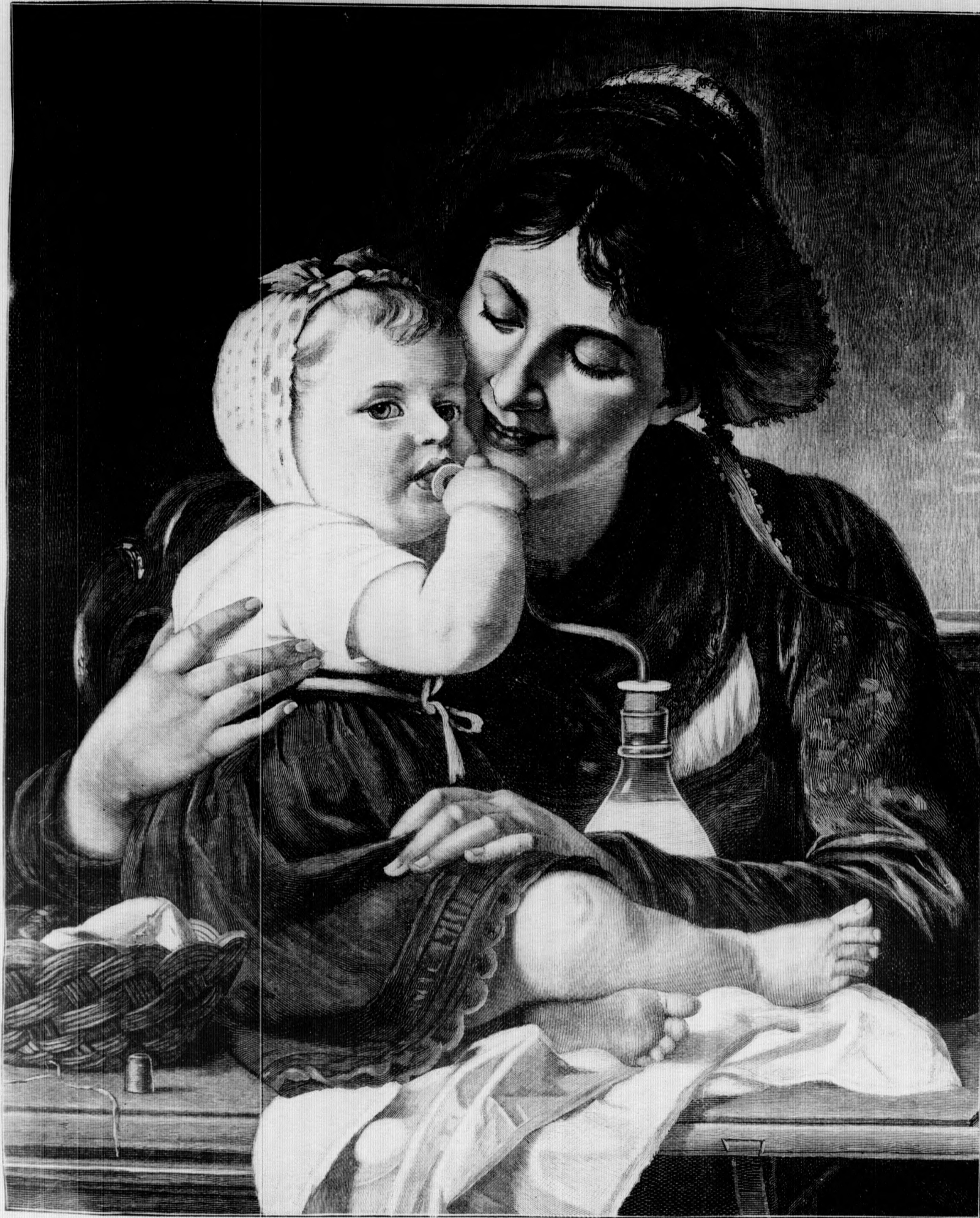
Beim Frühstück. Nach einem Gemälde von H. Epp. (S. 64)

Zeit war er im Kultusministerium beschäftigt. Sein besonderes Arbeitsgebiet war die Kunst, im besonderen die Verwaltung der Staatsgalerien, der staatlichen Museen und des Germanischen Museums in Nürnberg. Daneben gehörte er dem Kompetenzkonfliktssenat an, und bei den letzten internationalen Ausstellungen fungierte er als Regierungskommissär. — Durch Professor Pupin, der rechnerisch