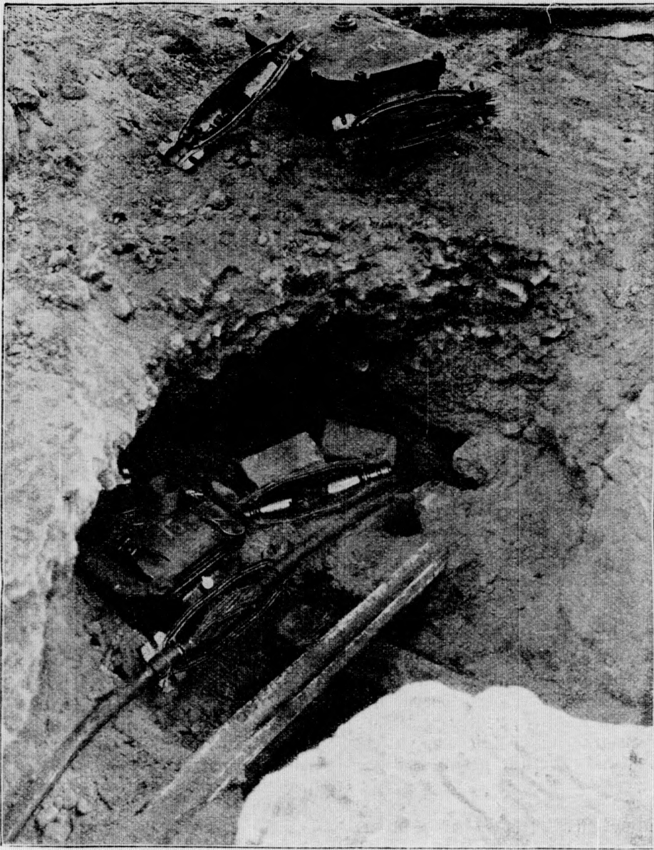
Die neueste Erfindung im Fernsprechen: Wie ein Erdlabel mit Papinipulver versehen wird. (S. 63)