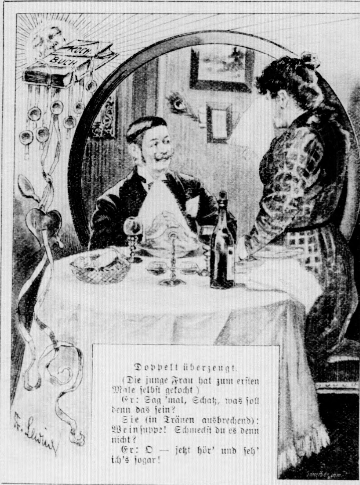
Doppelüberzeugt. (Die junge Frau hat zum ersten Male selbst angetrunken.) (Sie: Soll mal, Schatz, was soll denn das sein? Sie (im Tränen ausbrechend): Weinst du? Schmeckst du es denn nicht? Er: O — jetzt hör' und seh' ich's jogaht!)

„Ja, Eure,“ entgegnete der Marschall, „und zwar hat er sie mit solcher Wucht geschleudert, daß sie bis in den königlichen Park von Versailles zurückgeprallt sind.“ [G. S.]