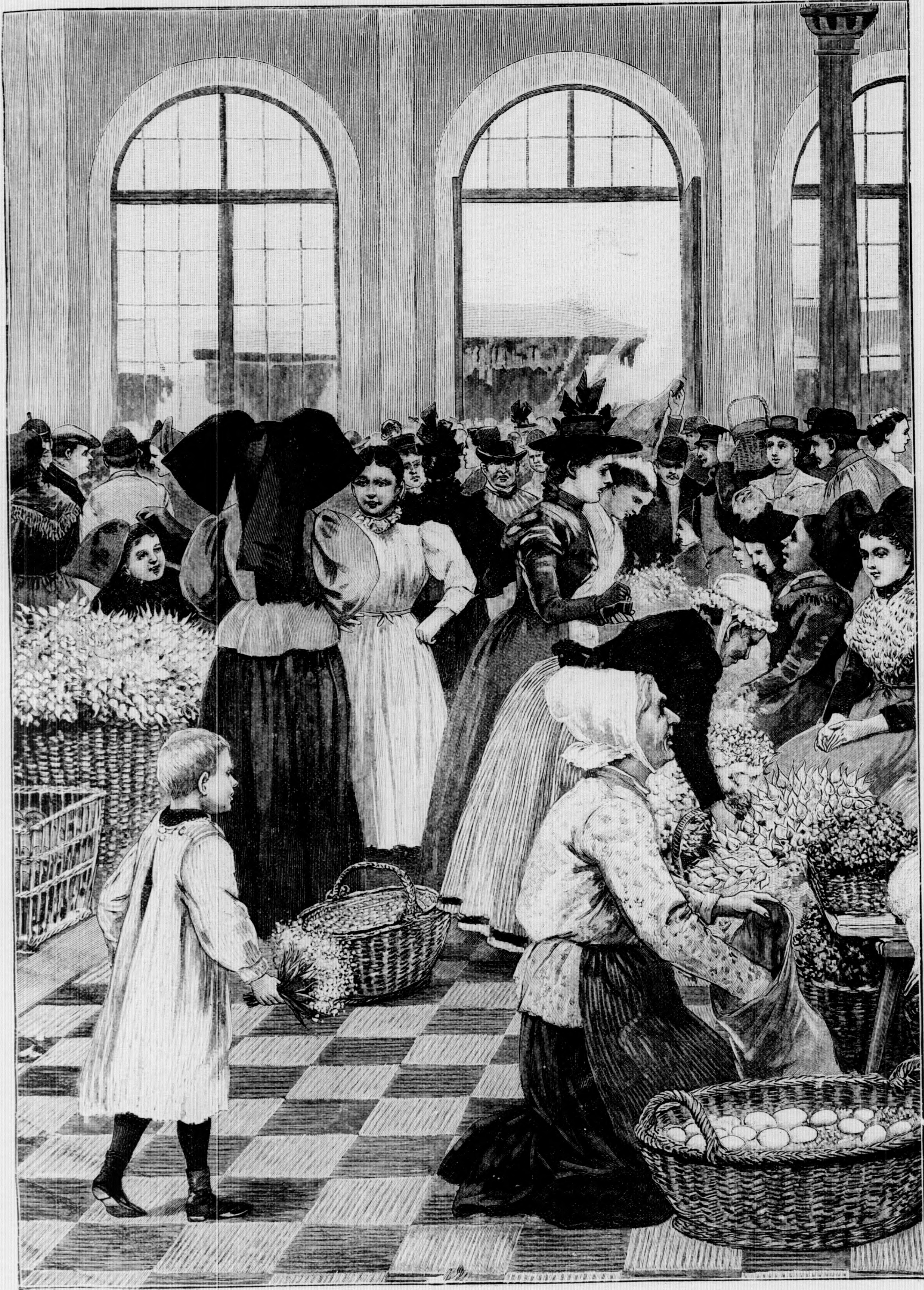
Markttagsleben in Straßburg i. E. (S. 196)