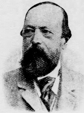
Gustav v. Moser †. (Z. 196)

Was nun unsere Angelegenheit betrifft, so glaube ich, dieselbe steht gut. Ich meinerseits habe meine Pflicht getan, und wenn Sie nun Ihrerseits den richtigen Griff an dem jungen Manne getan haben, kann uns das Geschäft gar nicht entgehen. Ich glaube, Sie haben ein leichteres Spiel als ich, und Ihre große Gewandtheit, Ihre Fähigkeit, nicht nur geschickt, sondern auch poetisch zu reden, kommt Ihnen gewiß mehr zu statten als mir meine geschäftsmäßige Mäßigkeit. Indes habe ich alles getan, was getan werden mußte. Die junge Dame ist bereit, auf meinen Vorschlag einzugehen. Ich habe sie in einer Gesellschaft getroffen und ihr lange, lange von der Annehmlichkeit des Landlebens erzählt; ich glaube sogar, ich bin poetisch geworden, und Sie hätten Ihre Freude an mir gehabt.