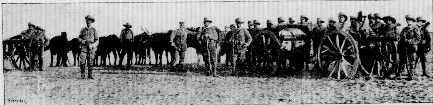
Eine Abteilung der Schutztruppe in Deutsch-Südwestafrika. (Z. 196)