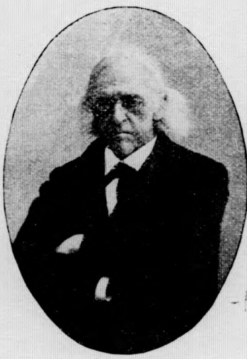
Theodor Mommsen v. (S. 190)