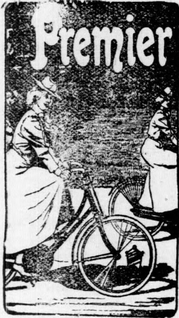
Premier-Fahrradwerke Eger, Böhmen.

sind tonangebend in Qualität. Unerreicht im Preise. Grösste Fabrikation Oesterreich-Ungarns.