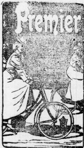
Premier-Fahrradwerke Eger, Böhmen.

sind tonangebend in Qualität. Unerreicht im Preise. Grösste Fabrikation Oesterreich-Ungarns.