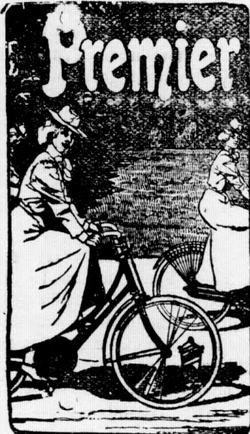
Jahresproduktion über 110.000 Fahrräder Premier-Fahrradwerke Eger, Böhmen

sind tonangebend in Qualität. Unerreicht im Preise. Grösste Fabrikation Oesterreich-Ungarns.