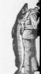
Echt nur mit Marke — dem — als Garantie des SCOTT Verfahrens

männlichen Temesvár Gefegentw ruhe der wurde bes schrift zu Provinzstä sonntags etwa 400 Angestellte treten. De