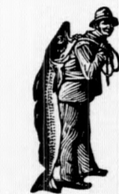
Echt nur mit dieser Marke — dem Fischer — als Garantiezeichen des SCOTT'Schen Verfahrens!

Dies ist die Erfahrung von Tausenden während den vergangenen 32 Jahren.