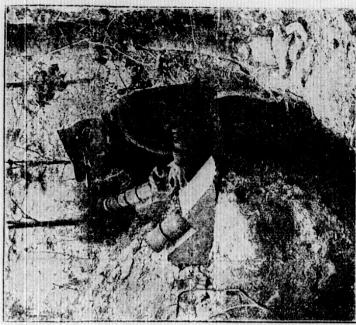
Der Maulwurf, französischer Bombenwerfer, hergestellt aus deutschen Geschosshülsen (S. 28).

„In Ihrem Auto schaffen wir's in drei Stunden — vorausgesetzt, daß das Ding gut und sicher besauf läuft. Sie sehen übrigens aus der Boffung der Depesche, daß unmittelbare Lebensgefahr vorliegt.“