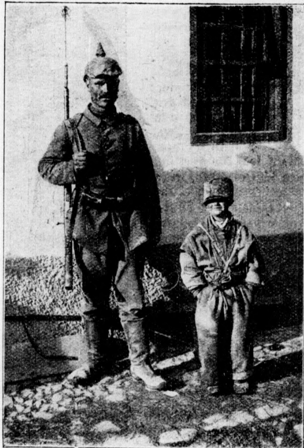
Ein Kriegsgefangener serbischer Hecke.

Was konnte der Amtsrichter von ihm wollen? Diese Frage beschäf-