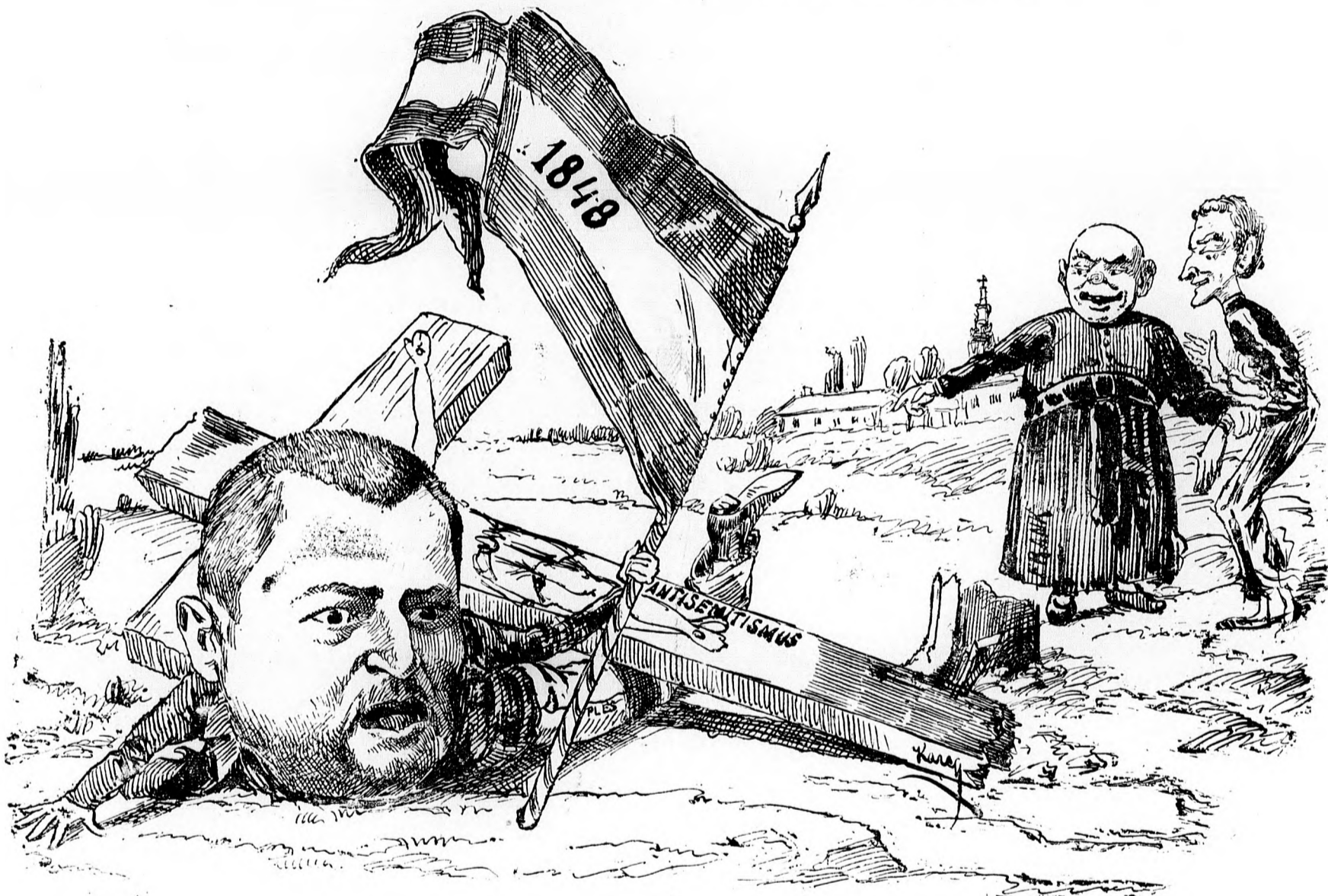
Pless: A zászló sértetlen!