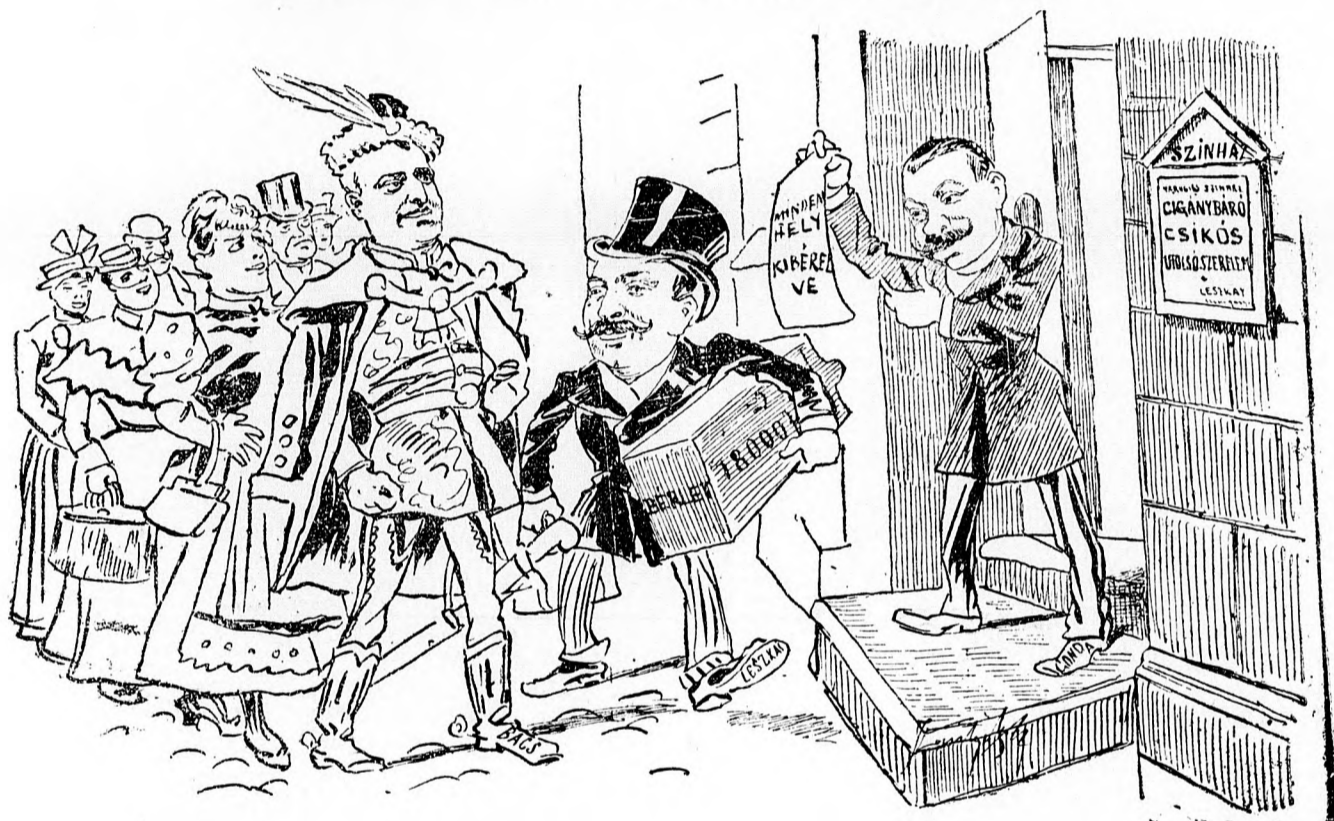
Jantyik Máttyás rajza.

Direktor: 18 ezer frt a bérlet! Hátha még a másik Áporkai művésznőt is elhoztam volna?