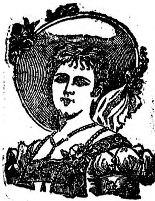
mein Portrait als Schutzmarke.