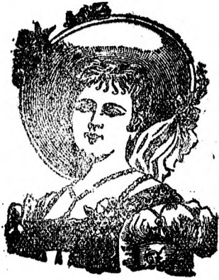
meine Portrait als Schutzmarke.