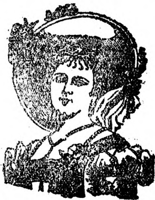
meine Portrait als Schutzmarke.