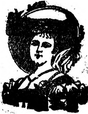
meine Potrait als Schutzmarke.