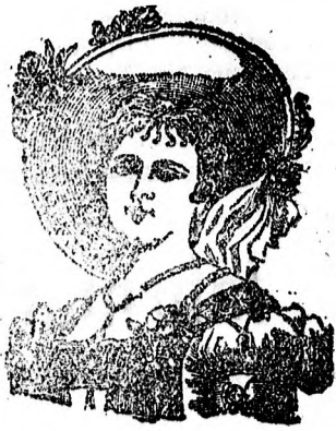
meine Portrait als Schutzmarke.