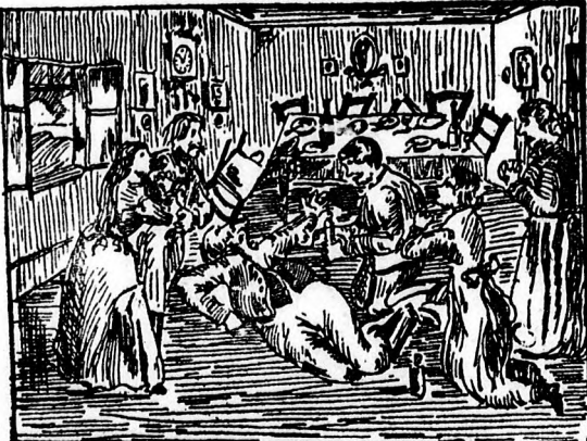
Der Großbauer öffnete die Augen und lispelte: „Noch! Noch!“