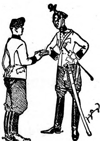
Hast du dir's noch immer nicht gemerkt, daß ich nur JACOBI ANTINICOTIN Zigarettenhüllen rauche.