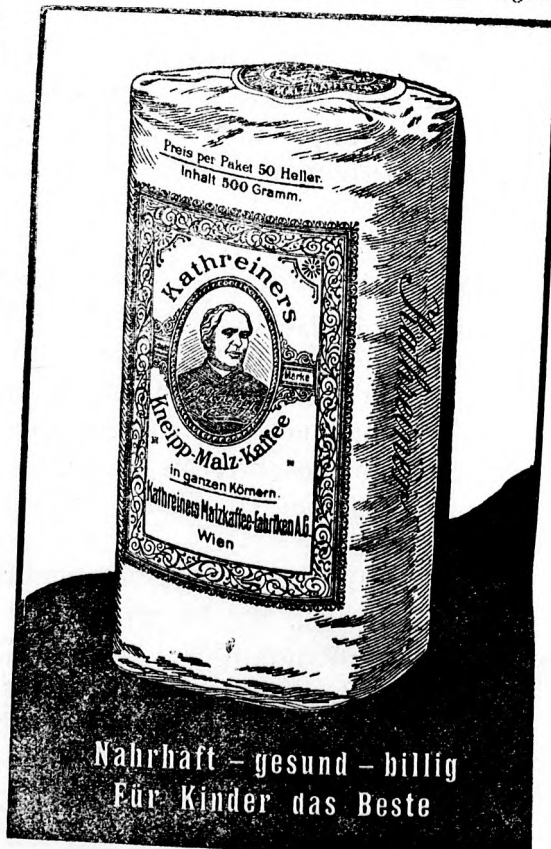
Nährhaft - gesund - billig Für Kinder das Beste

Der königl. ung. Unterrichtsminister transferierte die Kindergärtnerin Kamilla Winter in Boskambanya in gleicher Eigenschaft an die staatliche Kinderbewahranstalt nach Lugos.