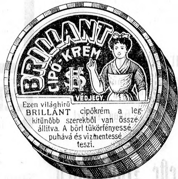
Cipókrém-gyár, Schuhcrème-Fabrik, Boksánbánya 435

G eschäftslokal in der Széchenyigasse samt anstoßender Wohnung per 1. Mai zu vermieten.