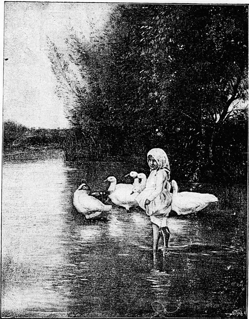
A LIBUSKÁK. Tölgyesy Arthur festménye után.