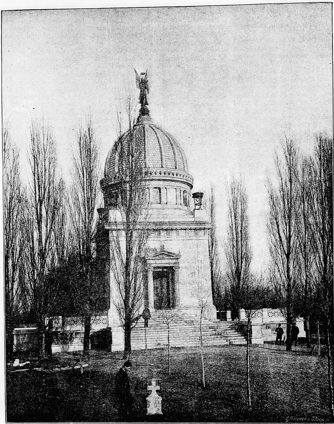
A DEAK-MAUZOLEUM A KEREPESI-ÜTI TEMETŐBEN.