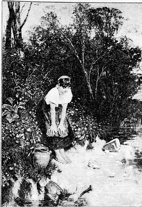
A GYIK. Vágó Pál festménye után.

A kedvezőtlen halálozási statisztikából jogosan azt lehet következtetni, hogy