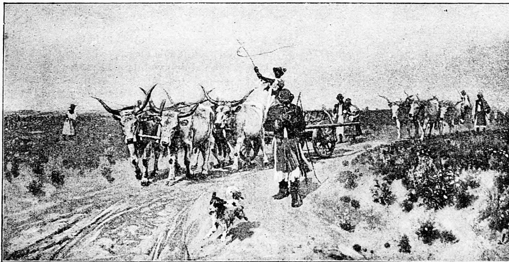
VONÓNÉGYES. Vágó Pál festménye után.

Ha még feltesszük, hogy Magyarországon a halálozási arány 38-ról 28-ra csökkenne minden ezernél négy évenként, 15 millió lakosságot véve fel, 150,000 emberrel kevesebb halna el s 510,000-rel kevesebb megbetegedés léteznék, 127 millió 500 ezer kevesebb ápolási nappal.