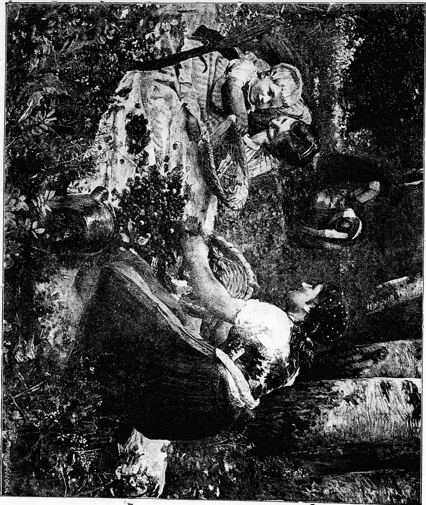
EPERSZEDÉS. Szirmai Antal festménye után.