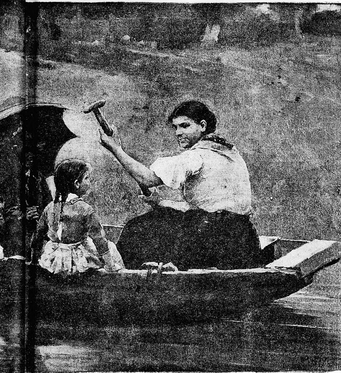
VÁN. Biri Sándor festménye után.

A lányka még jobban elpirult, ajkára nem jött felelet s én jónak láttam bemenni az öregekhez, kik lelkesen diskuráltak arról, hogy milyen egészséges multság a lovaglás.