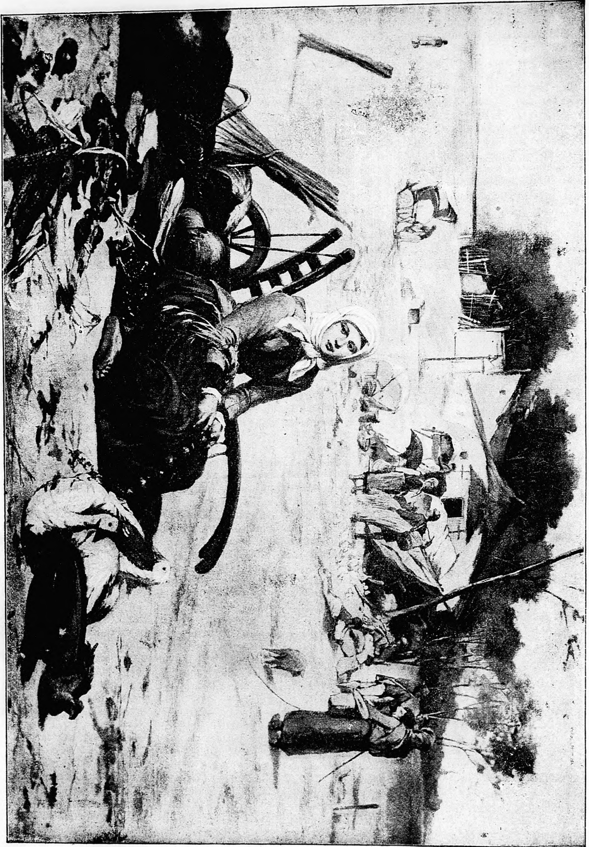
A vásáron. Pörge Gergely festménye után.