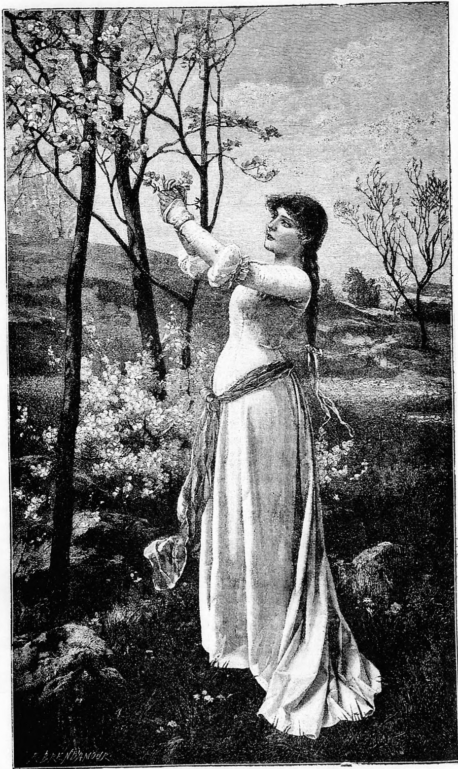
Egy szál virágot!

Nancy a legtisztább és legrendezettebb város egész Franciaországban. Szépség dolgában sem mérkőzhetik vele Párison kívül másik. Számos remek építményei közül különösen fel