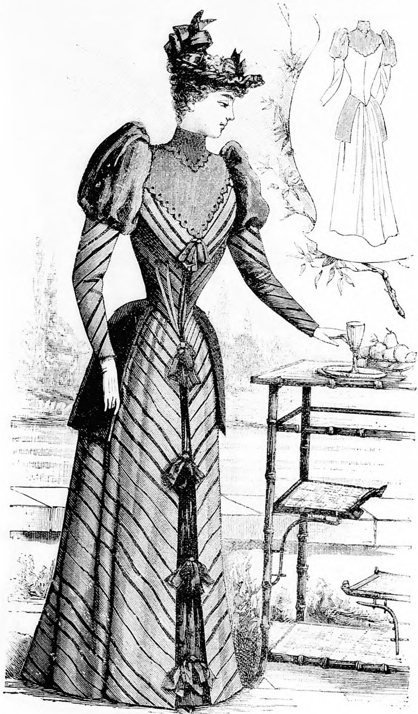
U t c z a i r u h a.

nemsokára duzzadt képződmény jön létre, a mit való vagy elválasztó réteg- nek szoktak nevezni. Ezen új képződ- mény folytonos növekedése által a levelet az ággal összekötő csomók mindinkább lazulnak, míg végre az összefüggés oly csekély, hogy egy kis szellő, vagy a levél saját sulya ele-