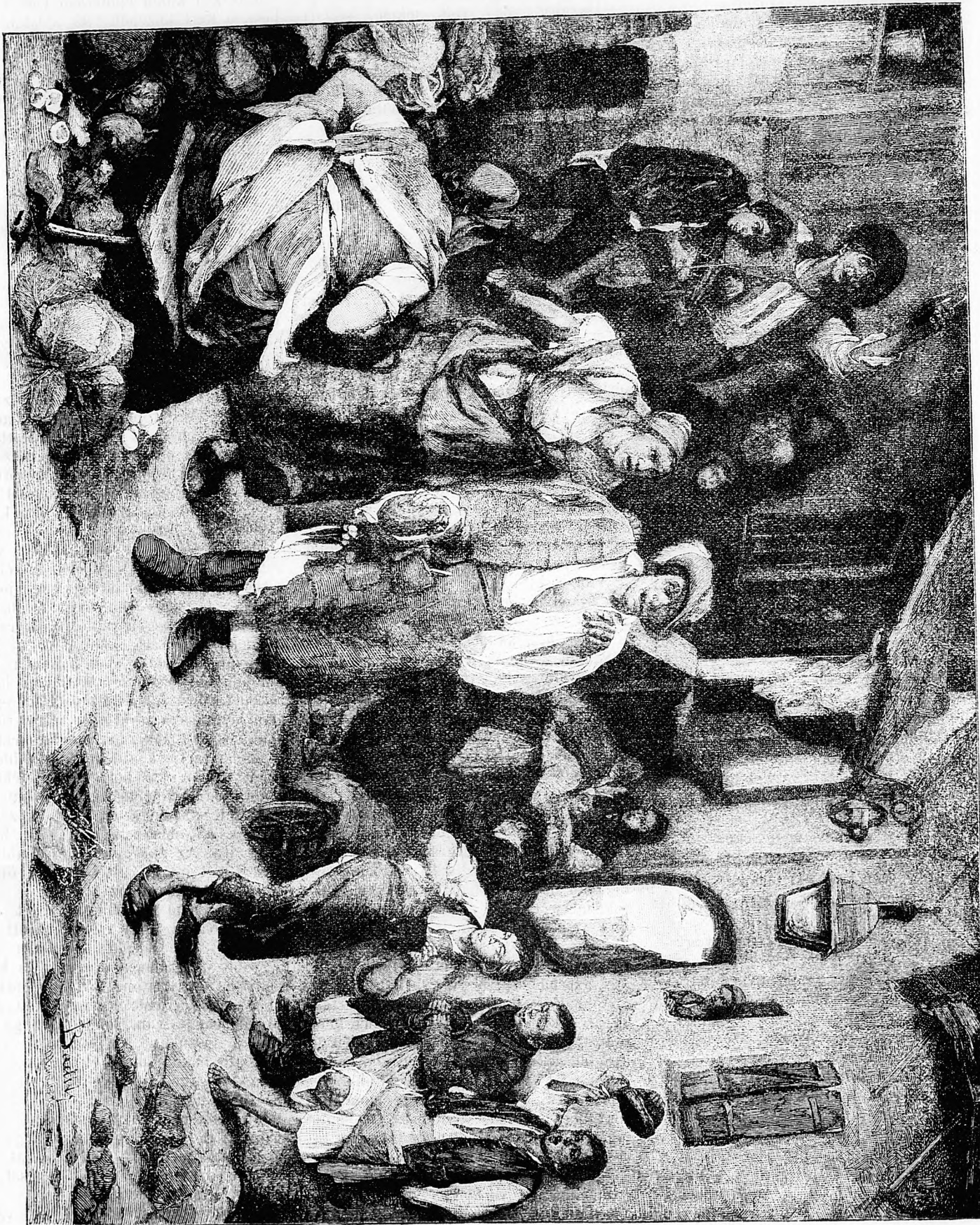
A fatu rossza. Baditz Ottó festménye után.