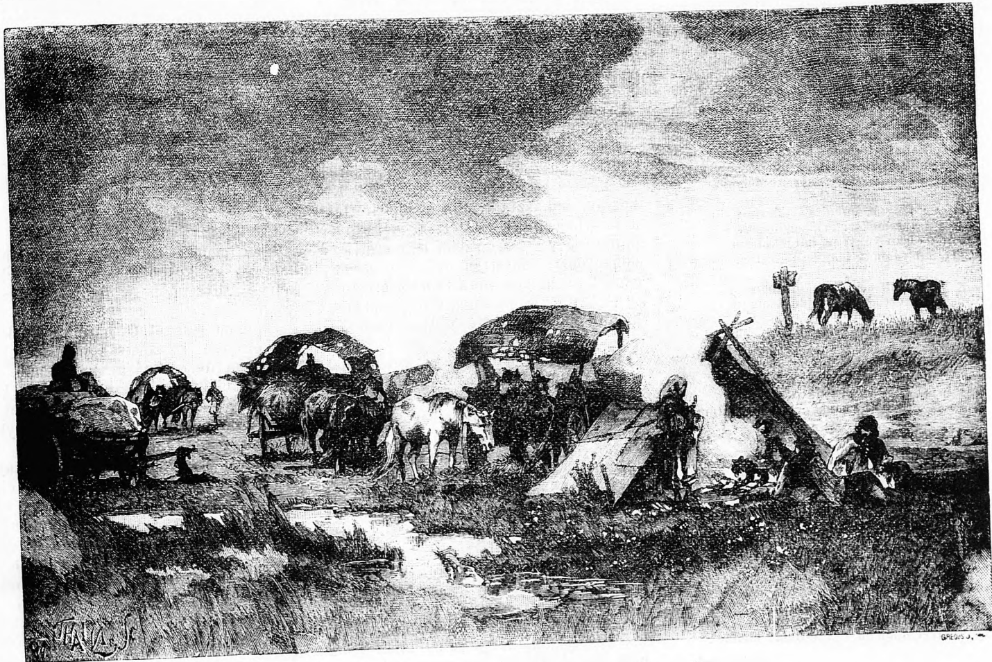
Vándor cigányok. Greguss Imre festménye után.

A szegény Jób! Egész nyáron mind Nemes urnak engedelmeskedett, Ilonkát mond gyűlölte. Aztán milyen mélységes gyűlölet volt az, mindig rá gondolt.