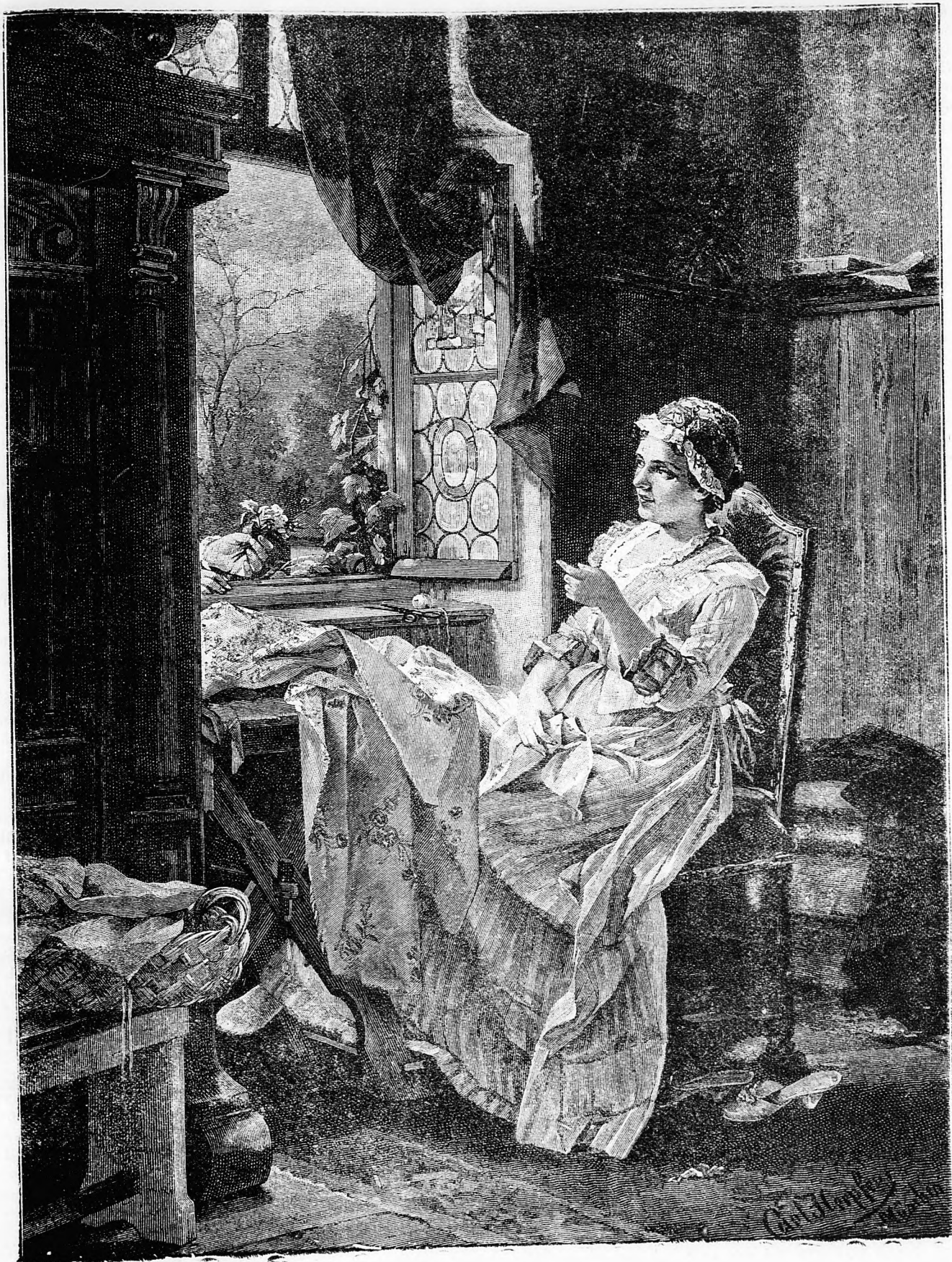
K e d v e s k e d é s .