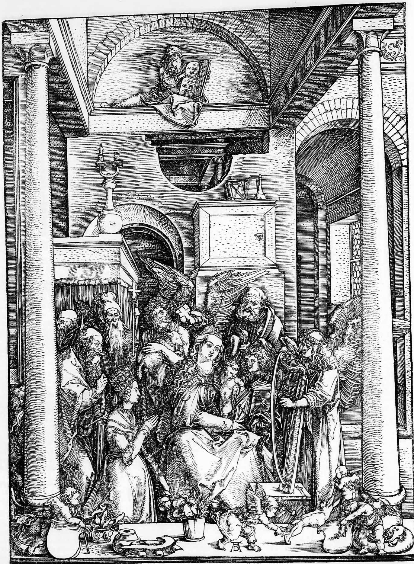
A kis Jézus, Dűrex festménye után.