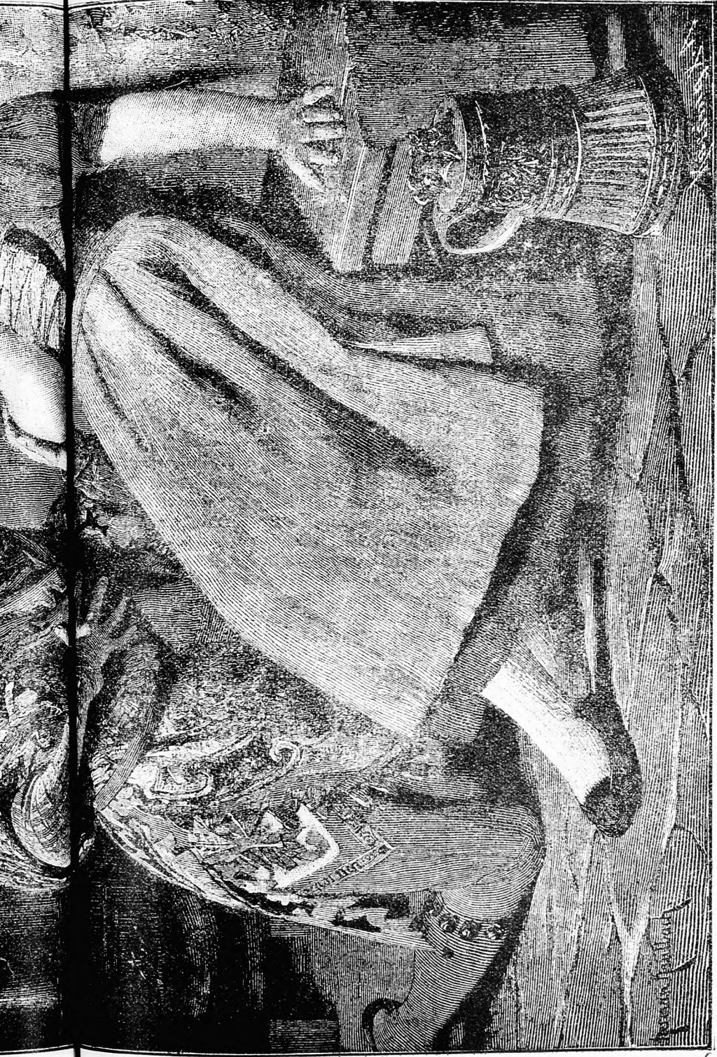
MÁSODVIRÁGZÁS. Kaulbach festménye után.

Kinn vakító fénysugár cikázott a feketeségen keresztül s utána iszonyatosat dördült.