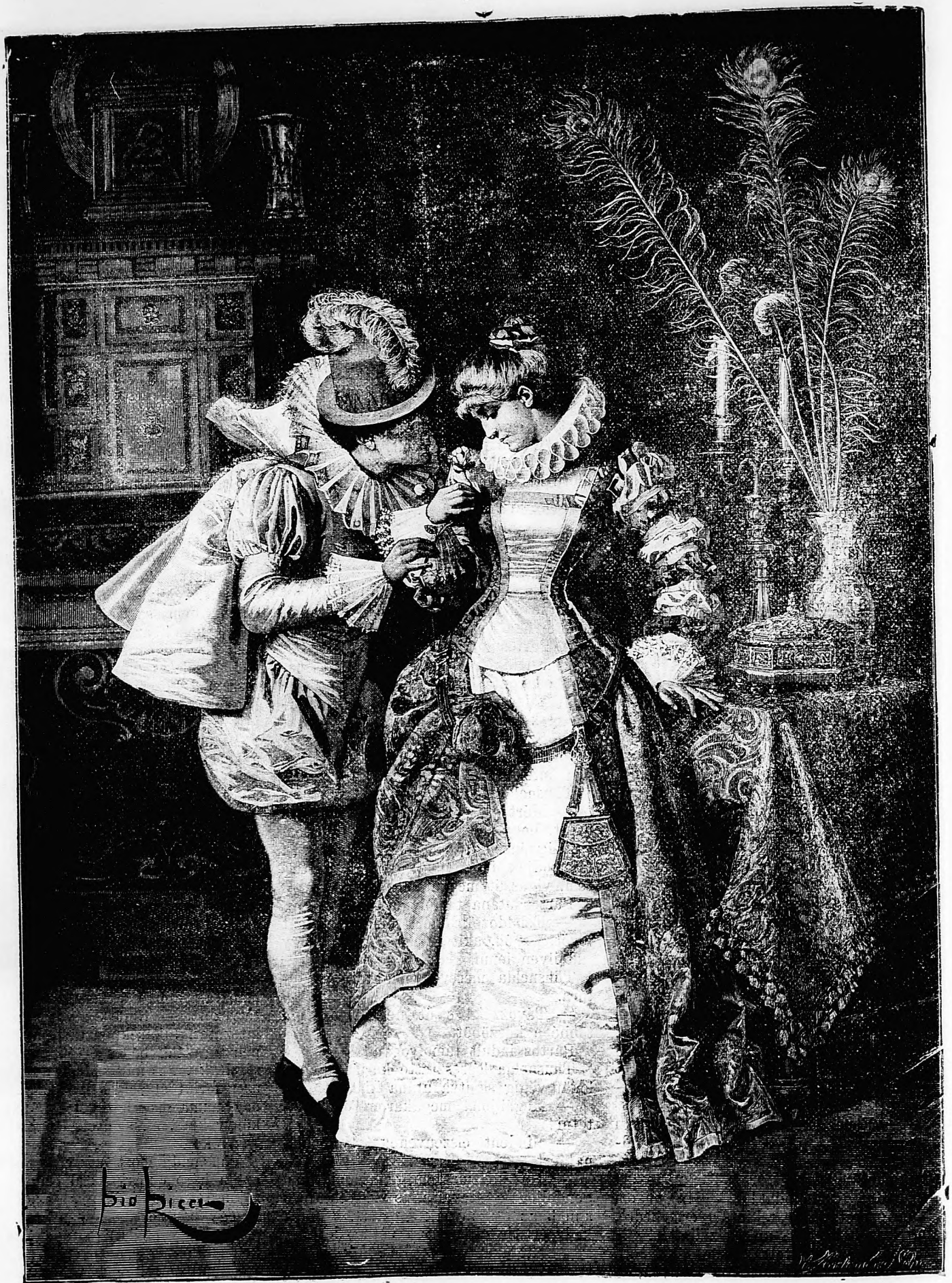
„Valamit sugok magának.“ Ricci festménye.

De ma kü inl és gy vé viz me gy jöt — lo tö to vé bü vé bü be tá ne zu az lö m ne ne ac te ol es k pi fe ne ki L m fi es az fi — n s eg h