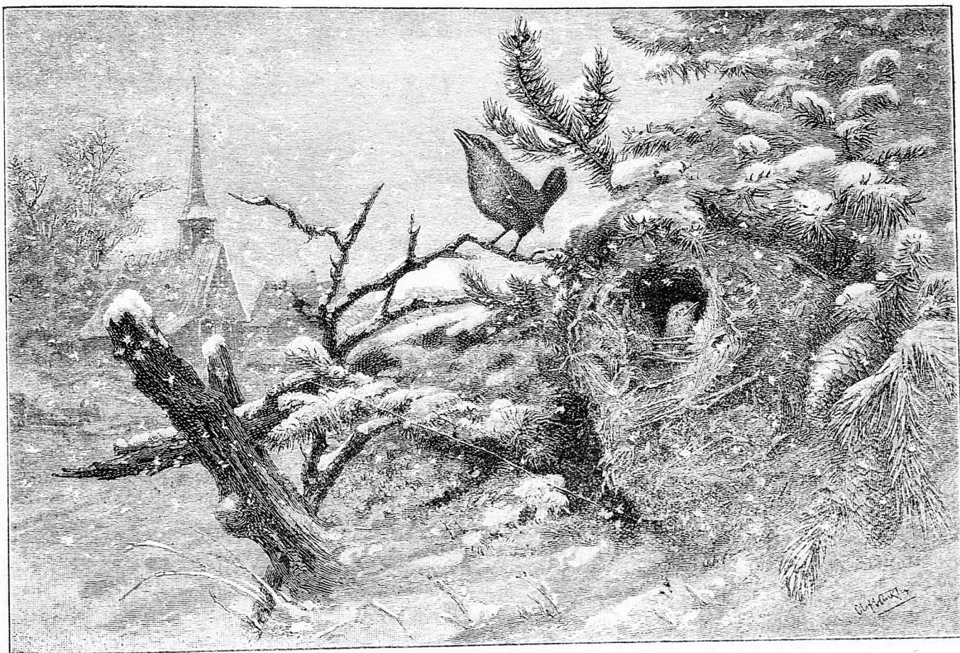
A tél proletárjai.

Arnyéket lássak sűrűn mindenütt, Czikás villámot, mely a földre üt, Lássam a gyöngöt porban vérzeni