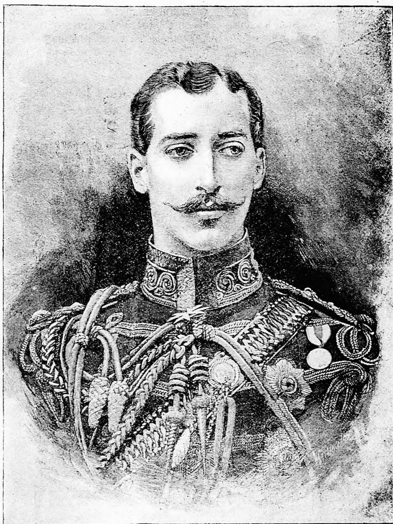
Albert Viktor herceg. †

A clarencei herceg influenzában szenvedett, melyből tüdőgyulladás keletkezett. A betegség olyan rohamosan fejlődött, hogy e hó 13-án még nem tartották szükségesnek az esküvő nap-