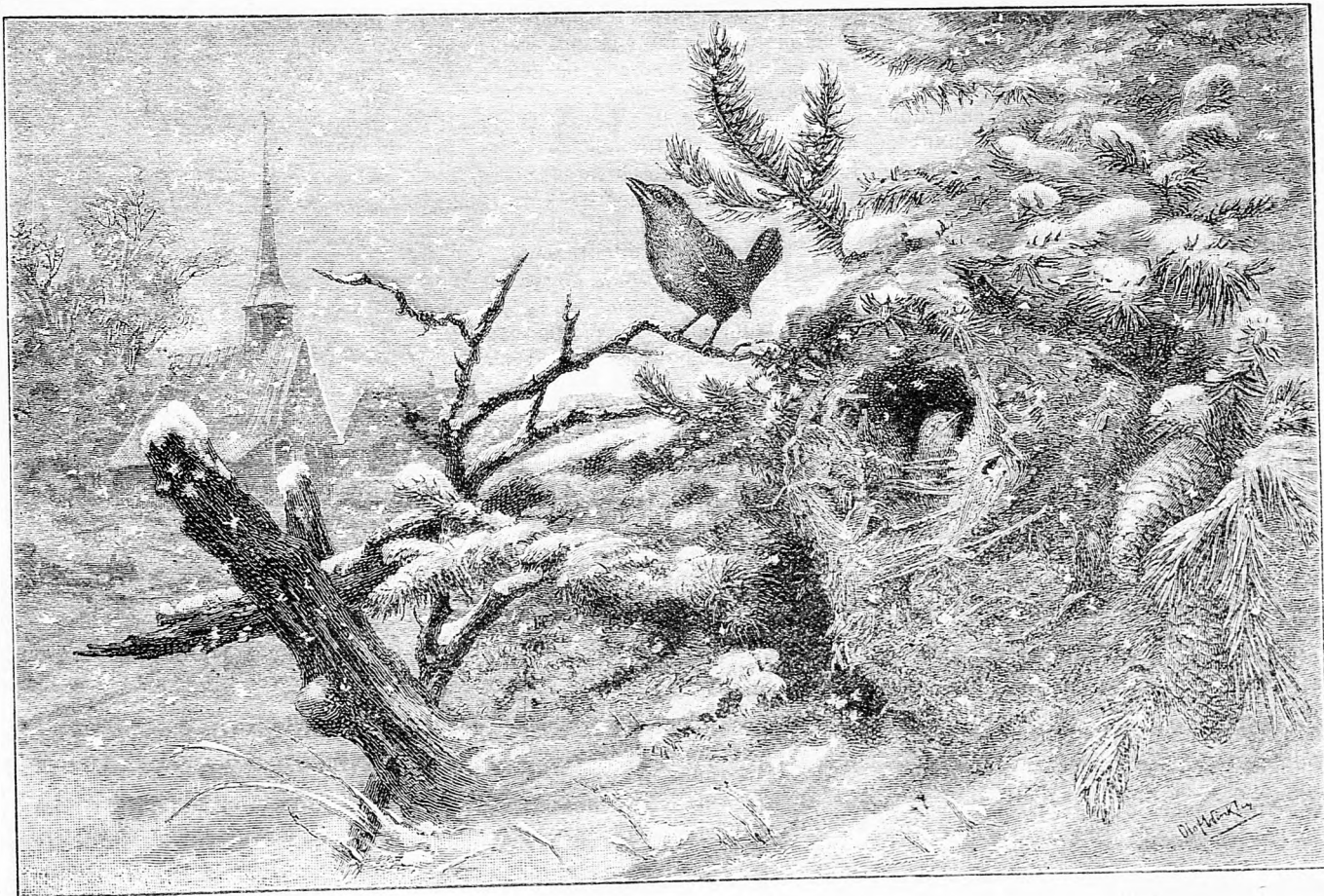
A tél proletárjai.

Arnyéket lássak sűrűn mindenütt, Czikás villámot, mely a földre üt, Lássam a gyöngöt porban vérzeni