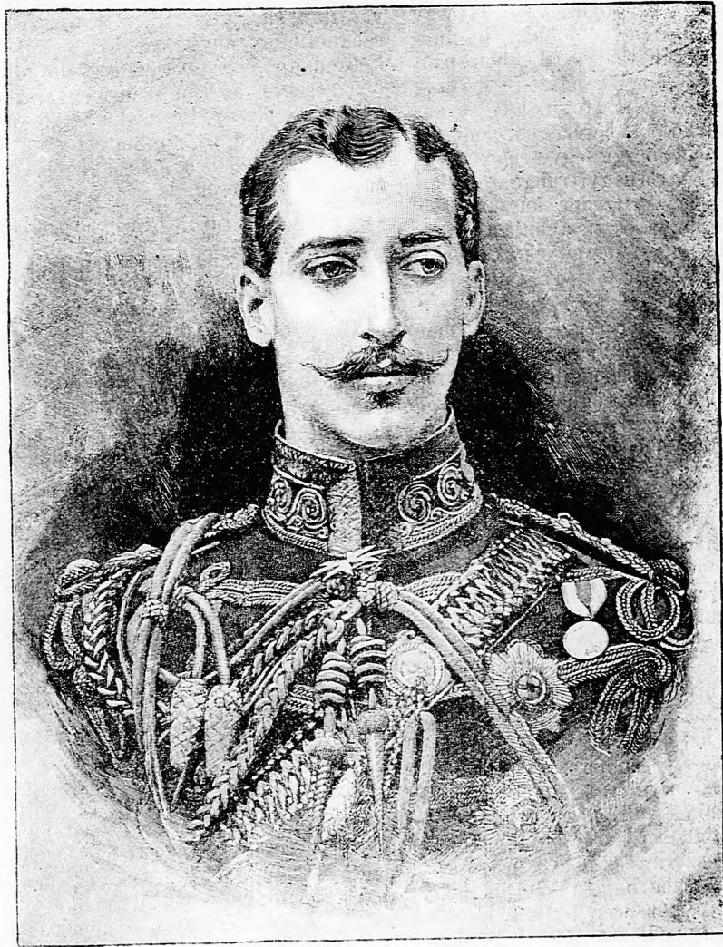
Albert Viktor herceg. †

A clarencei herceg influenzában szenvedett, melyből tüdőgyulladás keletkezett. A betegség olyan rohamosan fejlődött, hogy e hó 13-án még nem tartották szükségesnek az esküvő nap-