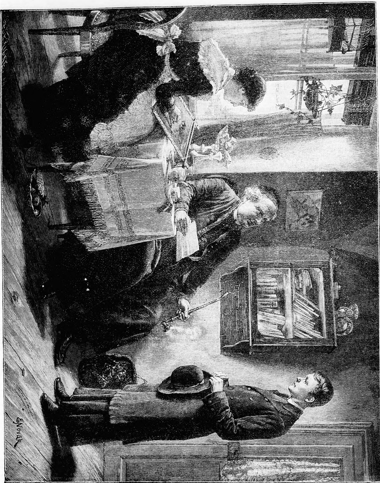
Az új káplán. Novák E. festménye után.