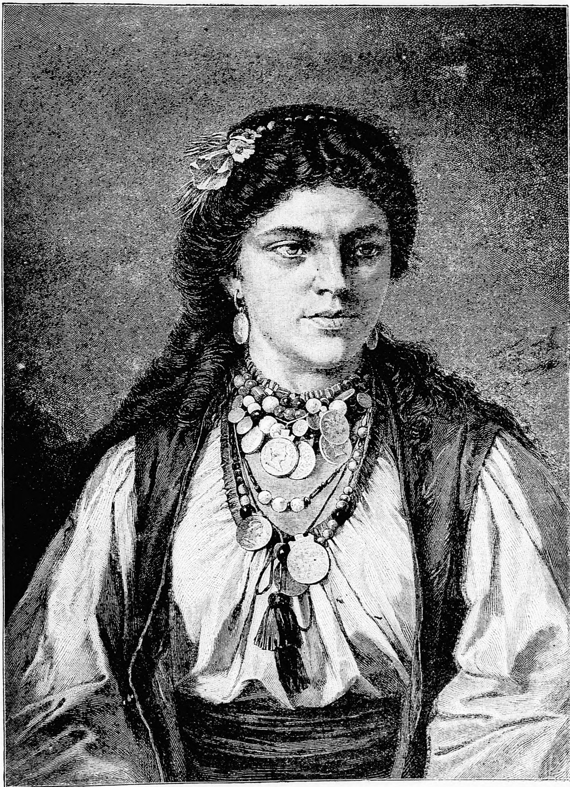
R o m á n l e á n y.

Midőn Sennyei, mint a jobboldali ellenzék vezére, letette a mandátumot, azt a direktívát adta bizalmas barátainak, hogy elsőbb igyekezzenek a pártot fentartani, a mint van; mert ha a ki-