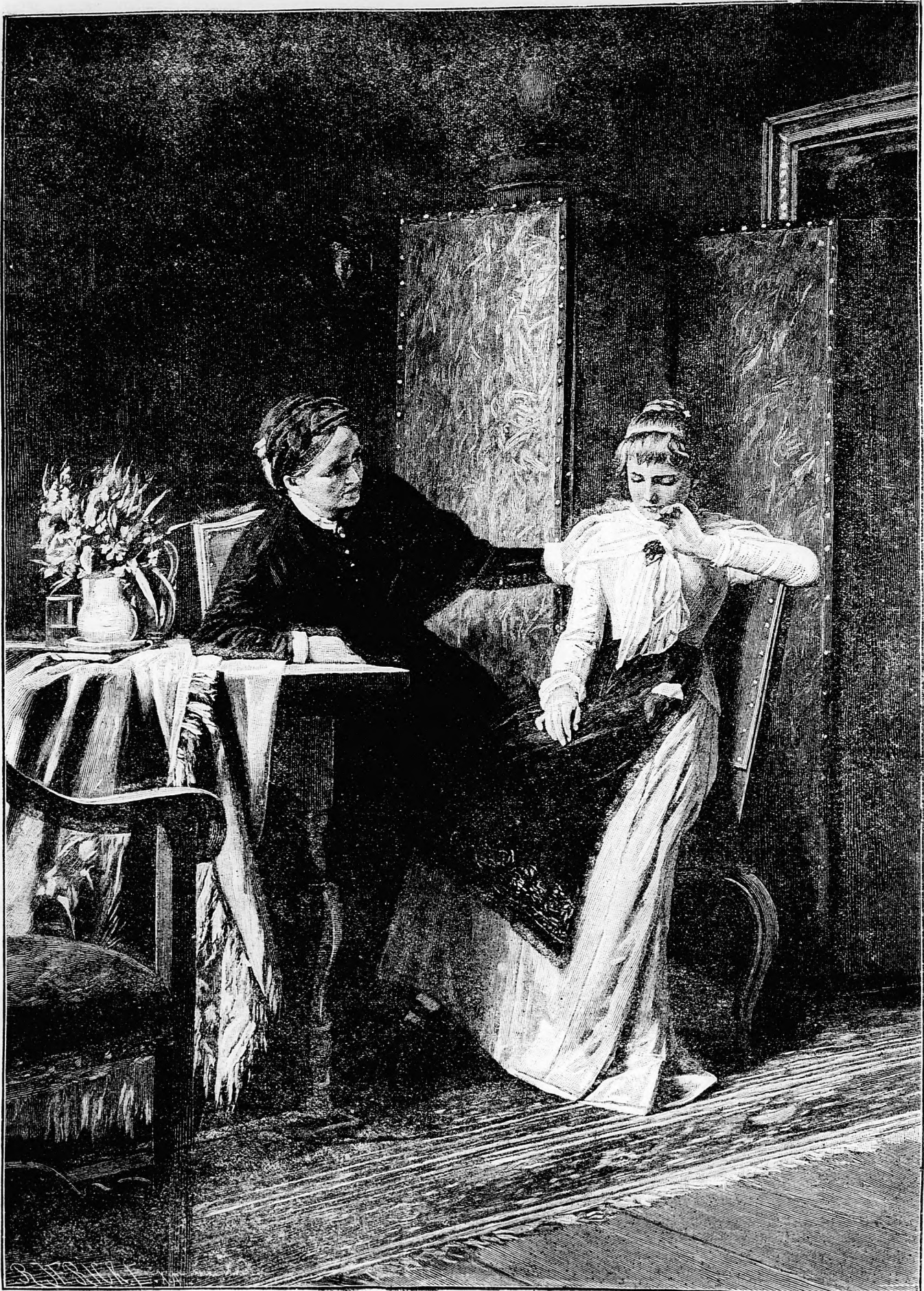
V I G A S Z T A L Á S .