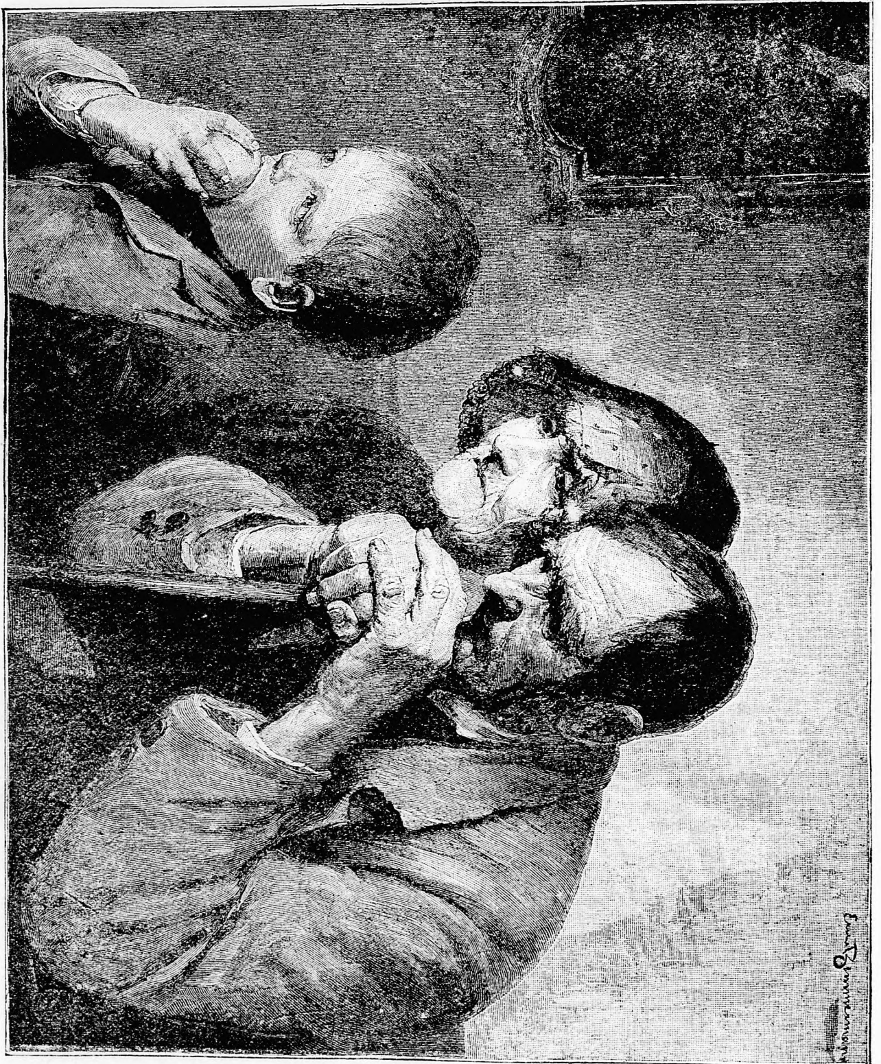
A t e m p l o m b a n .