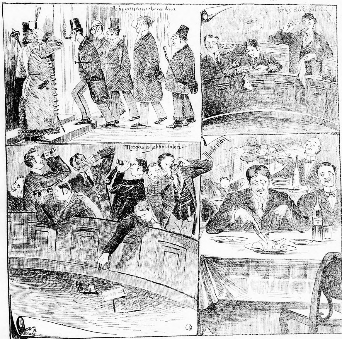
Az új nemzedék. (Kép a t. házból.)