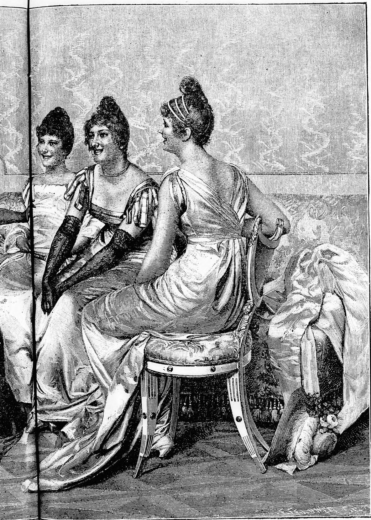
ry kis nykázás.