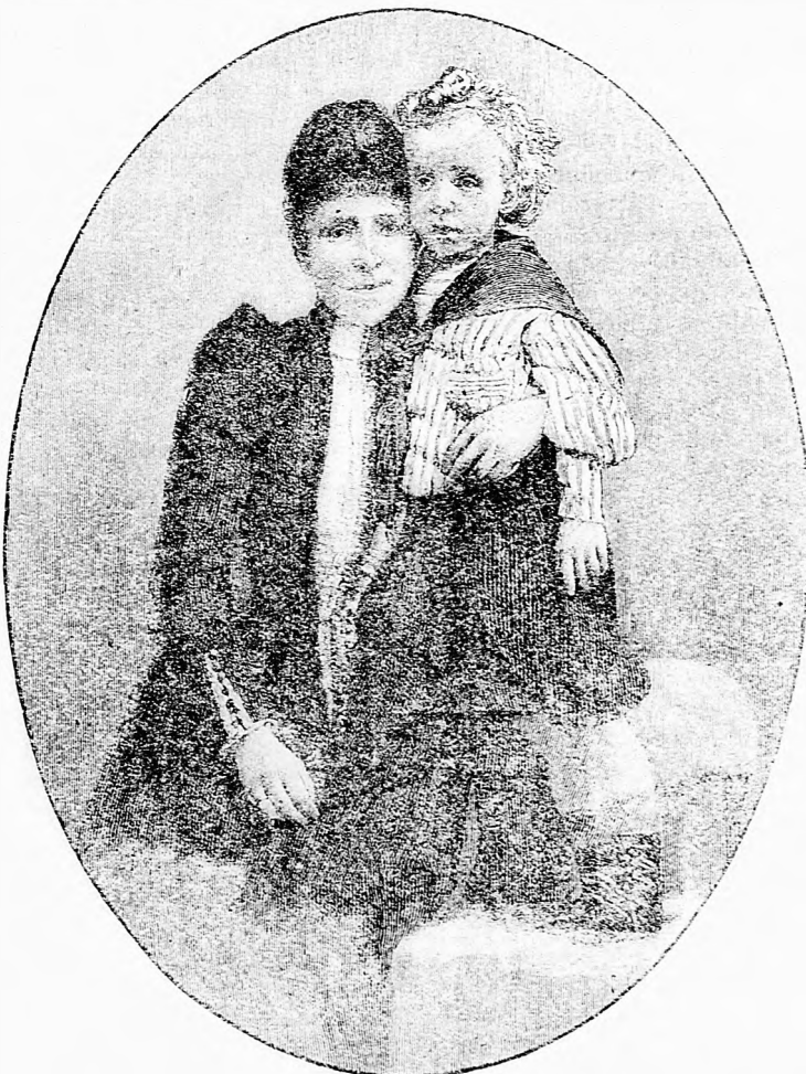
A kis spanyol király.

gatatag megegyezés létezik, a mely a jelenlegi állapotokat esetleg Mária királynő elismerését garantirozza. Don Carlos csakis abban az esetben nyulna ismét fegyverhez, ha kísérlet történne arra nézve, hogy a mostani dinasztíát