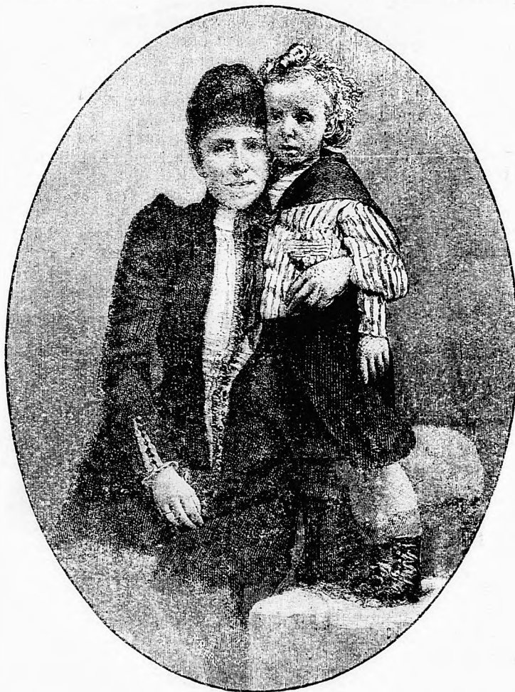
A kis spanyol király.

gata megegyezés létezik, a mely a jelenlegi állapotokat esetleg Mária királynő elismerését garantirozza. Don Carlos csakis abban az esetben nyulna ismét fegyverhez, ha kísérlet történnék arra nézve, hogy a mostani dinasztiát