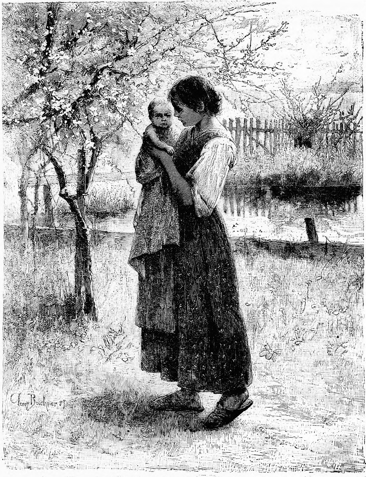
A tavasz virágai.