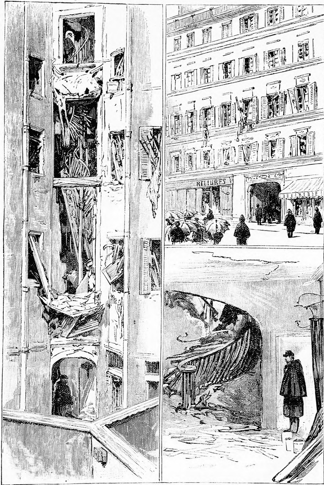
Dinamittal felrobbantott ház Párisban.