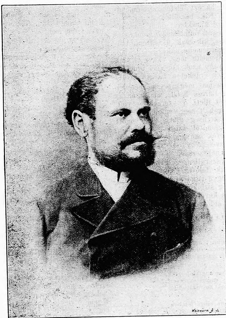
BAROSS GÁBOR. †

korunk iránya a chauvinizmus felé hajlik és ő chauvinista volt. Az volt a főtörekvése, hogy Magyarországot Ausztriától gazdaságilag függetlenné tegye. Ezért dolgozott az ipar érdekében, ennek a czélnak volt alárendelve köz-