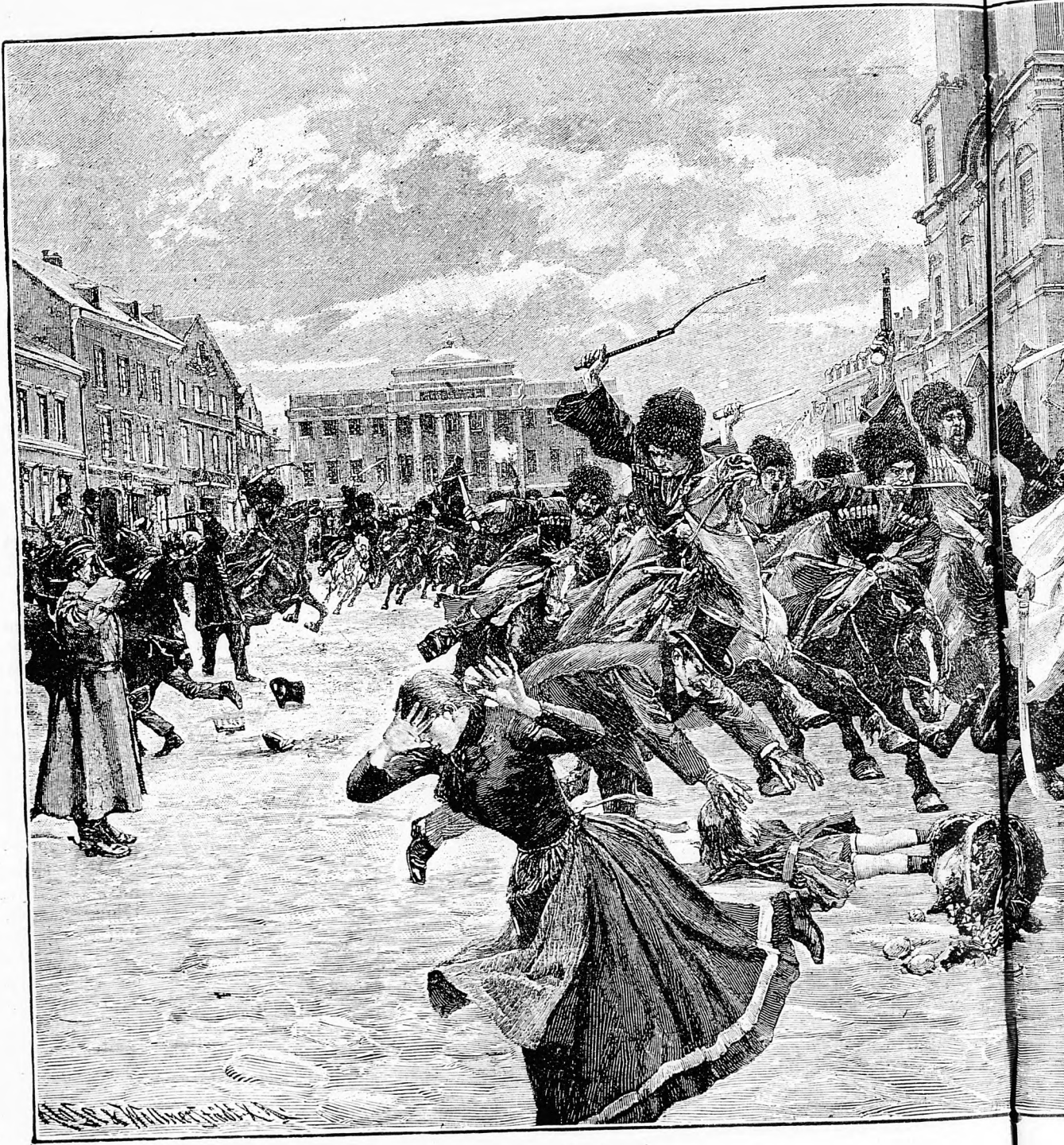
A LENGYEL FÖLKELEZÉSEK IDŐJÉB