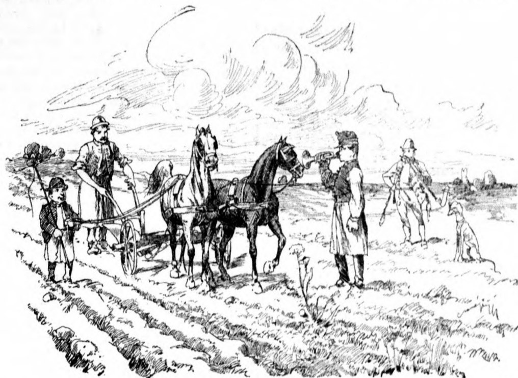
A hlásnik zatrúbil «generál-marš».

Paholok založil pluh, Miško chytil opraty a hlásnik začal trúbiť „generálmars“ a hľa, kôň začal kráčať a tahať pluh v takom tempe, že paholok sotva stačil za pluhom. Kôň tahal a dľa maršu ani krok nezmylil. Oračka šla ako masle, ale čo keď hlásnik pri piatej brázde ustal