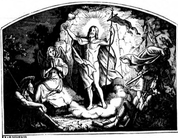
Vzkriesenie Krista Pána.

ktorého zošľachtení a o ktorého blaho všetci dľa svojich síl pracovať máme — o ľudstve. Áno, vstal z mrtvých , riecť bude možno o celom ľudstve sveta len vtedy, keď prestane zášť, nenávisť jedného národa oproti druhému, keď prestane jeden utlačovať druhého, keď nebude treba na udržanie pokoja kanónov a pevností, keď nebude viac matka oplakávať v boji padlého syna, len vtedy bude to možno riecť o ľudstve, keď nastane bratská, spoločná láska všetkých národov sveta — a keď nabudne všeobecnej platnosti to utešené, ale aj vznešené prikázanie: «miluj bližného svojho, jako seba samého!»