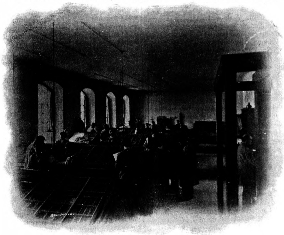
Sadzačské oddelenie v knihtačiarni.

Uvážme si vec vo všeobecnosti a zjádime od terajších časov o niekoľko sto rokov nazad. V časoch, keď králi chodievali prosit koruny do