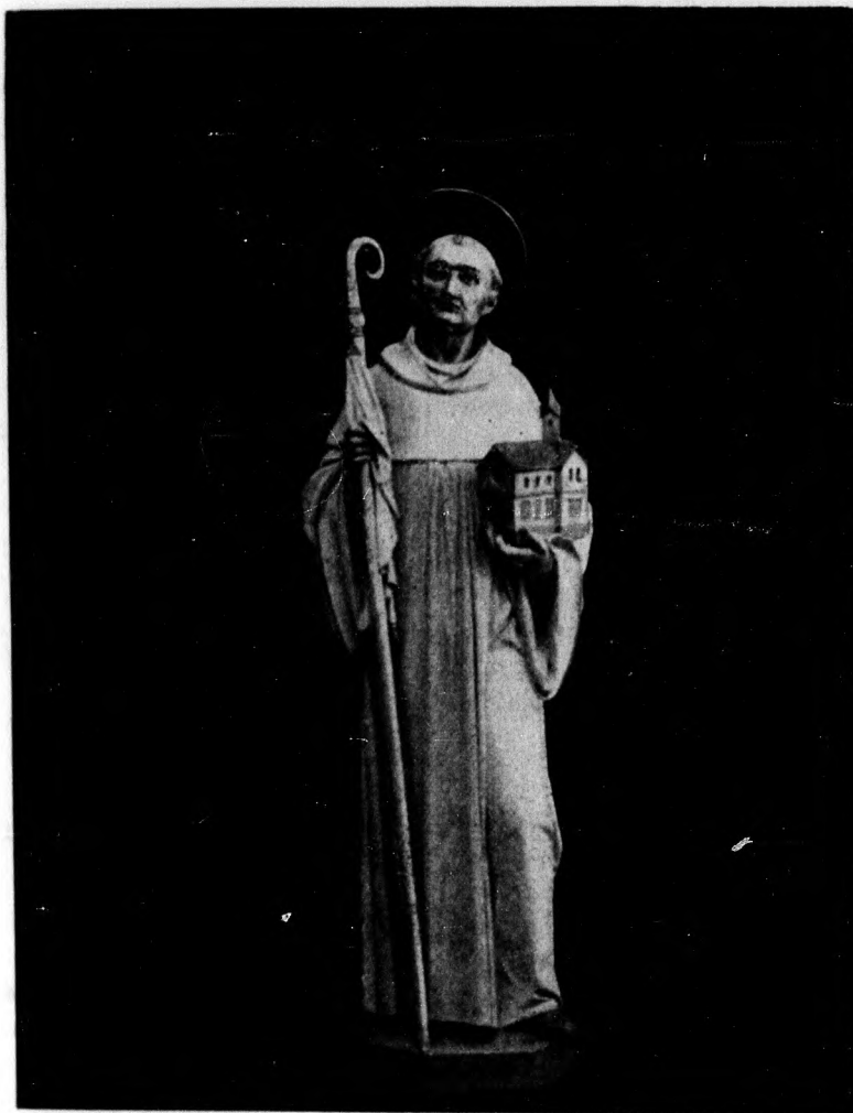
Sv. Róbert, zakladateľ cistercitov.