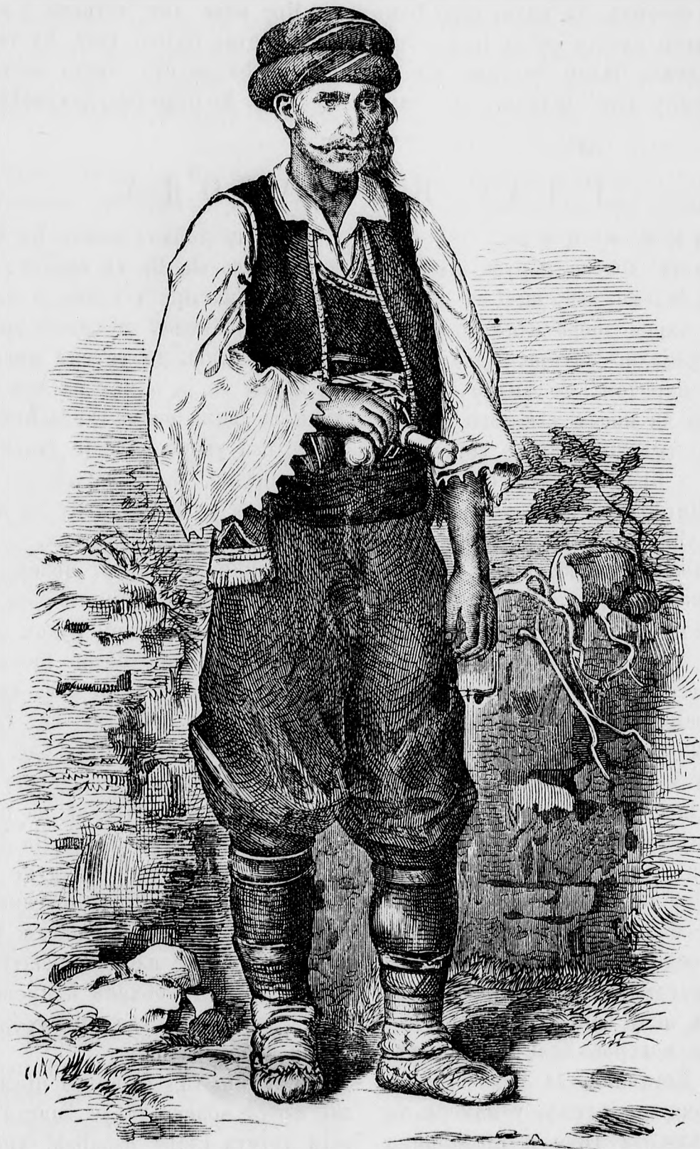
Б О Ш Њ А К.

термометар показује између 3 и 4 града. Десет минута доцније већ смо 3100 метара високо, термометар паде на нулу, а нама би прилично зима. Кожа ми на рукама и по лицу дође сува и затегнута, иначе ми беше са свим добро. Како мајушан беше свет под нама. Ноћ се већ спушташе. Коксуел отвори три пута капак, кад га по трећи ред